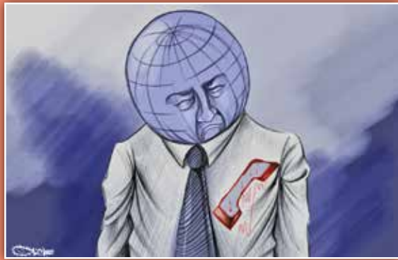
طرح: محمد سباعنه