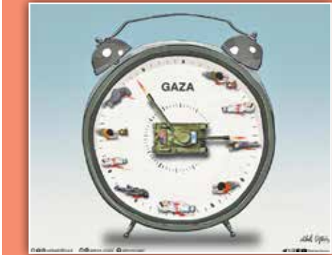
طرح: ميكائيل چيفتچي