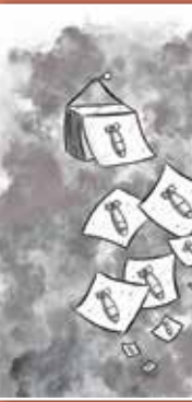
طرح: زهرا عمر اوغلو