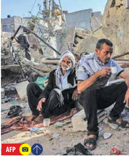
AFP ● ● ●

عقبگرد نگران كننده فلسطين به حد اكثر ۱۶ سال قبل براساس آنچه كارشناسان سازمان ملل برآورد کرده‌اند تبعات اقتصادي جنگ در باريكه غزه، به طور مستقيم و غيرمستقيم بر شرايط انساني و آوازي گسترده فلسطيني ها تاثير مي گذارد. به نوشته خبرگزاري آتاتولي، نكته قابل تامل آنكه بهبود شرايط اقتصادي در غزه بلافاصله بعد از آتش بس بعيد به نظر مي رسد چراكه حجم ويراني ها بشدت گسترده است. تاثيرات منطقه اي جنگ غزه نيز چندلايه اي نظامي و است. تاثيرات منطقه اي و گستردي تنش هاي نظامي وابسته است. درعين حال پس از يك ماه جنگ دست كم ۴۵ درصد خانه ها در غزه از بمباران هاي صهيونيست ها تخریب شده است. بنا بر گزارش سازمان ملل تا ۳ نوامبر ۲۰۲۳ شمار خانه هاي ويران شده در باريكه غزه دست كم ۳۵ هزار واحد گزارش شده و ۱۲ هزار واحد نيز تا حدودي آسیب