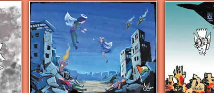
طرح: مو قاسم