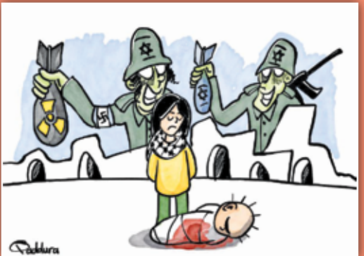
طرح: احمد قدورا