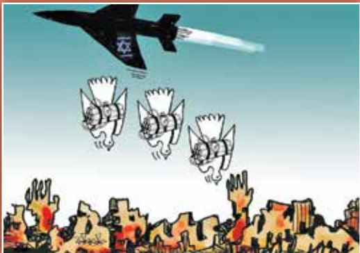
طرح: حسن بلبل