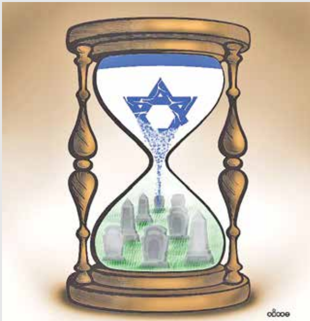
نیما مشاییری / طراح و کارتون‌نویست