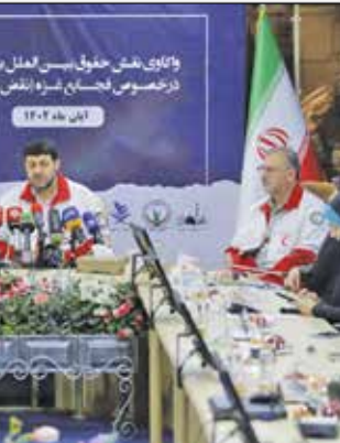
واکاو نقش حقوق بین‌الملل بشردوستانه در خصوص فجایع غزه نقش هلال احمر

او افزود: نکته اینجاست که صهیونیست‌ها از حمایت تمام قوه آمریکا برخوردار است. وقتی آمریکا خود را پیشرو در معاهدات حقوق بشرمی‌داند، به جای اینکه جنگ را محدود کند، حمایت مالی لجستیکی به رژیم صهیونیستی به میزان بیش از ۱۴ میلیارد دلار را انجام می‌دهد؛ خود در صحنه حضور دارد و در جنایات شریک است. ۴۰ هزار نفر تا الان در نوار