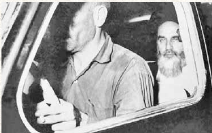
انتقال امام از قم به تهران