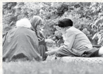
امام خمینی در دوران اقامت در دهکده نوفل لوشاتوی پاریس