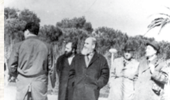
امام خمینی در دوران تبعید به بورسای ترکیه در سال ۱۳۴۳