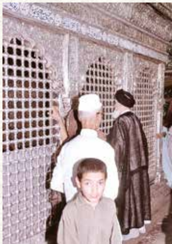
امام خمینی به هنگام زیارت مرقد امیر مومنان (ع) در دوران تبعید به شهر نجف

روز ۱۳ آبان یادآور سه رویداد مهم در تاریخ معاصر ایران است. تبعید امام خمینی (ره) به ترکیه در ۱۳ آبان ۱۳۴۳، کشتار دانش آموزان در ۱۳ آبان ۱۳۵۷ در دانشگاه تهران و تسخیر سفارت آمریکا در تهران در ۱۳ آبان ۱۳۵۸، سه رویداد مختلف بودند که