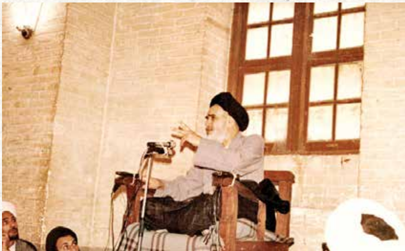
امام خمینی به هنگام تدریس در مسجد شیخ انصاری در دوران تبعید به شهر نجف