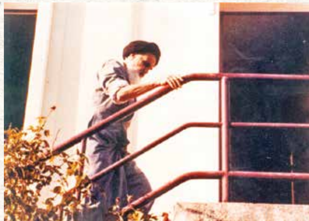
امام خمینی پس از وضو ساختن و به عزم نماز در دهکده نوفل لوشاتوی پاریس