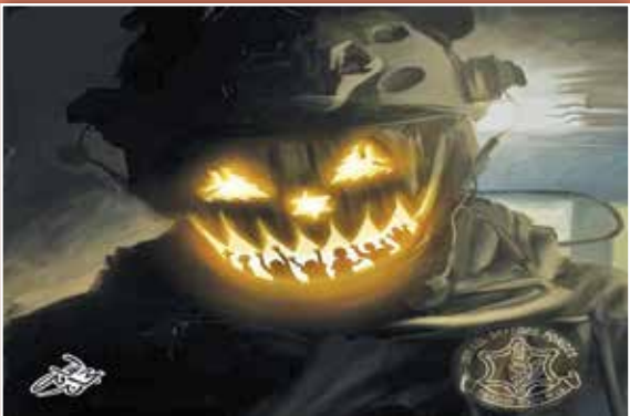
طرح: اسامه حجاج