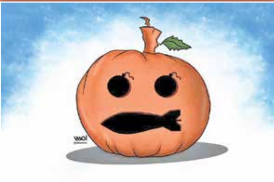
طرح: امین الحباره