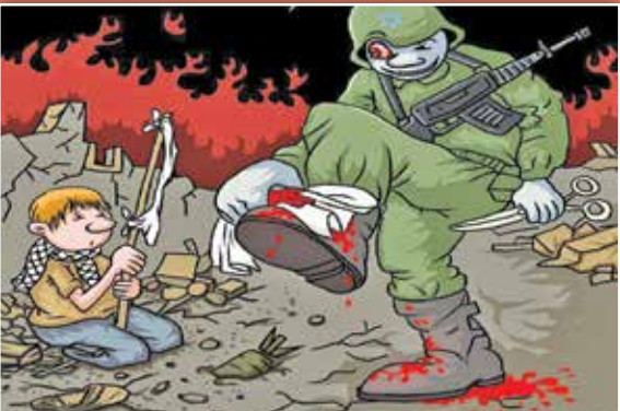
طرح: دمیر نواک