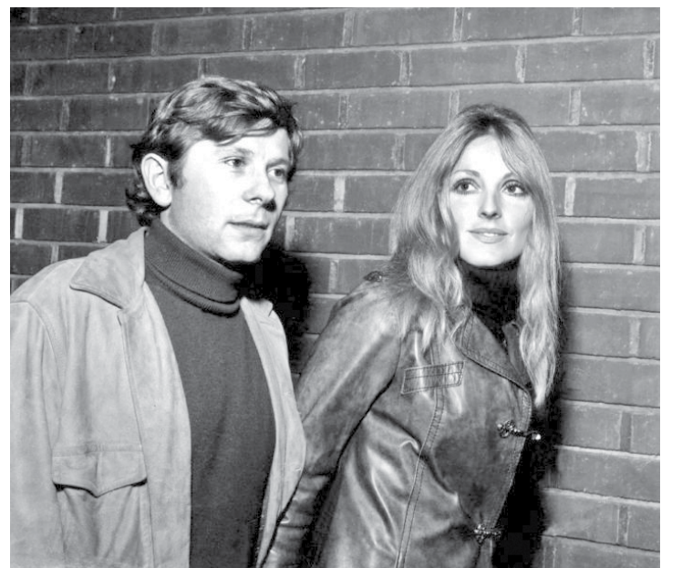
رومن پولاتسکی و همسرش شارون تیت