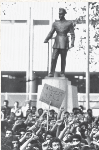
تجمع دانش آموزان و دانشجویان در ۱۳ آبان ۵۷