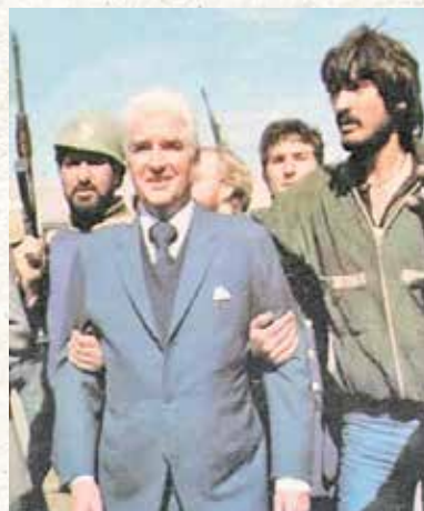
دستگیری ویلیام سولیوان (سفیر امریکا در ایران) توسط نیروهای انقلابی بعد از اشغال سفارت امریکا در تهران