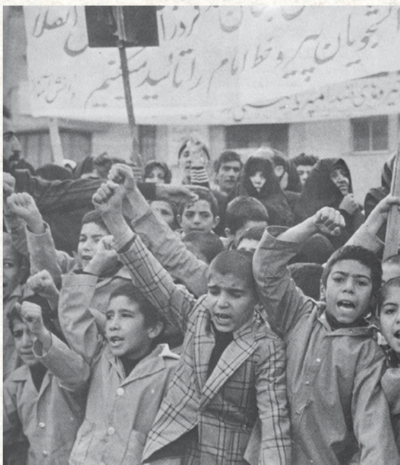
منابع: مؤسسه مطالعات و پژوهش های سیاسی پژوهشکده تاریخ معاصر