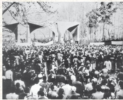
تجمع مردم روبروی دانشگاه تهران