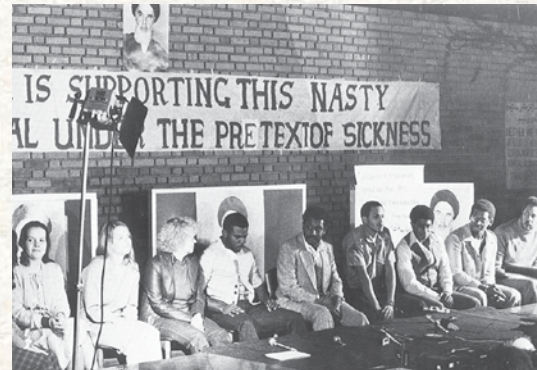
مصاحبه با جمعی از کارکنان سیاهپوست سفارت امریکا در ایران در آستانه آزادی