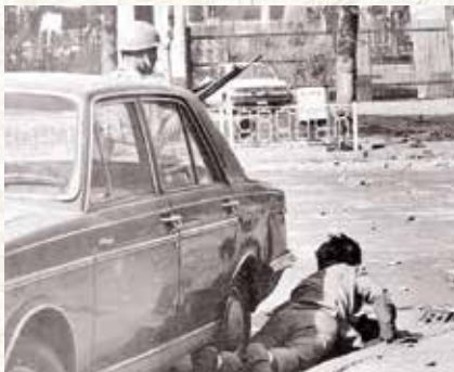
سنگر گرفتن مردم عادی برای در امان ماندن از حمله سربازان رژیم پهلوی