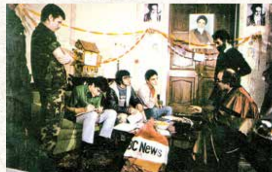
ملاقات فرستادگان ویژه امریکا با چند تن از کارکنان سفارت آن کشور در ایران بعد از تسخیر لانه جاسوسی توسط دانشجویان پیرو خط امام