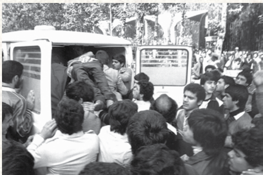
انتقال مجروحان و شهدا از مقابل دانشگاه