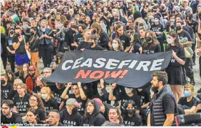
عکس: Anadolu نیویورک

موفاز با ابراز امیدواری نسبت به آزاد شدن اسرای صهیونیست گفت: «به نظر من، این بالاترین مأموریت دولت اسرائیل است. زندگی دشوار خواهد بود وقتی بدانید که ۲۲۹ نفر در حال حاضر در دست حماس هستند و ما نتوانسته‌ایم آنها را به خانه‌ها و خانواده‌هایشان برگردانیم. داستان شکستن توان نظامی حماس نیز یک وظیفه است ولی هر چند فکر می‌کنم هر دو ممکن است، اما صد درصد موفقیت نخواهد داشت. از بین بردن حماس و تفرک آن غیرممکن خواهد بود. اما برای از بین بردن توانایی‌های موشکی، تونل‌ها، مقادیر سلاح و مواد منفجره‌ای که ذخیره کرده است، و مهمتر از همه برای آسیب رساندن به نیروهای آن می‌توان کار کرد. نتانیاها فعلاً «گانته» و «ارنکووت» را کنار خود گذاشته تا شریک جرم داشته باشد و هر اتفاقی بیفتد بگوید دوزنرال ارشد در کنارم بودند. اما روزی که این جنگ تمام شود، نمی‌تواند نخست‌وزیر بماند. نسل فوق‌العاده‌ای از جوانان در این کشور رشد می‌کنند. آنها نمی‌گذارند این اتفاق بیفتد. همان‌طور که علیه کودتای قضایی بیرون آمدند، در مقابل این حکومت‌ها شکست‌های چینی برای توجیه نخواهد بود. این حکومتی است که برای همیشه در یادها باقی خواهد ماند. به خاطر شکست‌هایشان در طول سال ۲۰۲۳ و به ویژه در ماه‌های گذشته.»