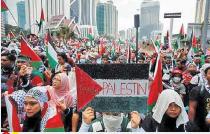
عکس: Reuters مائری