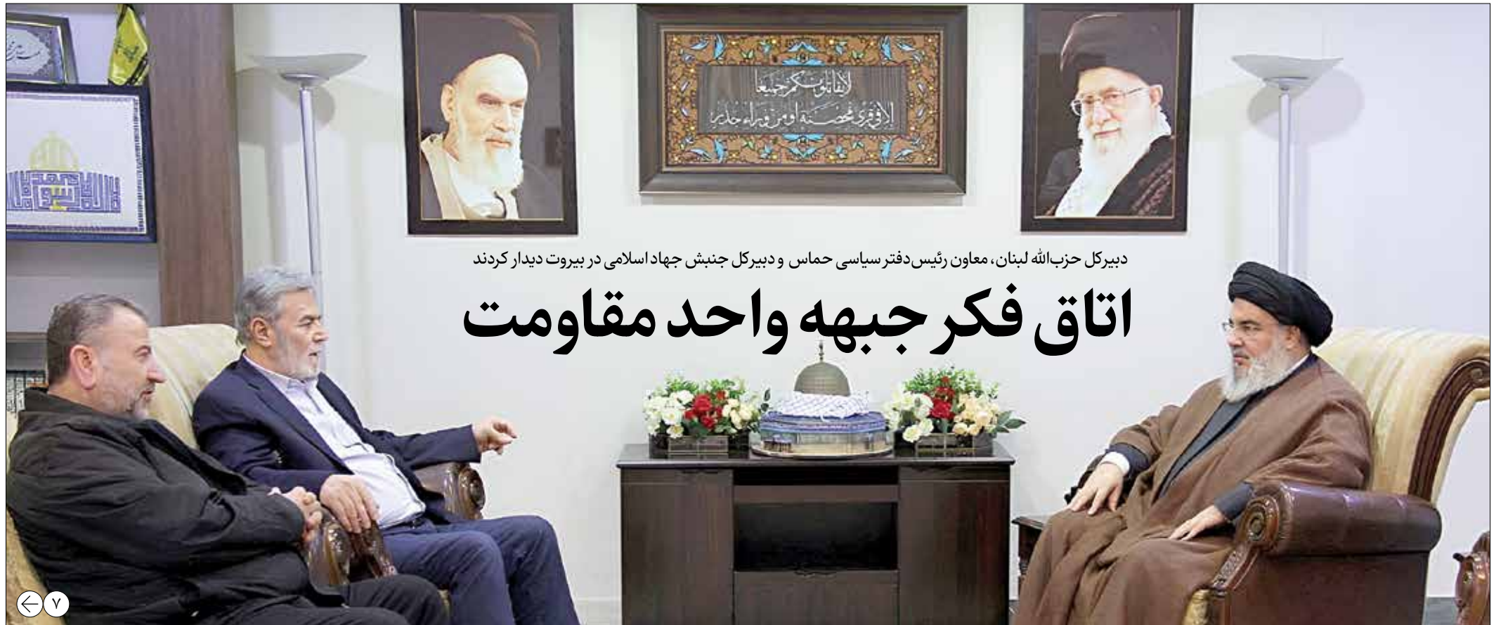
دبیرکل حزب الله لبنان، معاون رئیس دفتر سیاسی حماس و دبیرکل جنبش جهاد اسلامی در بیروت دیدار کردند