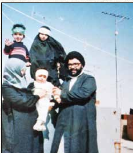
شهید سید عباس موسوی دبیرکل فقید حزب الله لبنان

شعار حذف حماس از فلسطین از سوی اسرائیل، یادآور یک حکایت تاریخی مشابه است. حکایت تلاش برای حذف حزب الله از لبنان. اولین شکست رسمی اسرائیل در لبنان از وقتی اسرائیل بخشی از خاک لبنان را در سال ۱۳۶۱ اشغال کرد، هسته های مقاومت میراث شهید چمران و امام موسی صدر در میان شیعیان جنوب لبنان بود، تقویت شد و سازمانی به نام بسیج عمومی مستضعفین شکل گرفت که بعدها به مقاومت اسلامی