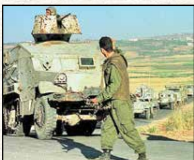
خودروهای زرهی شبه نظامیان حامی اسرائیل در جنوب لبنان ۱۹۹۹