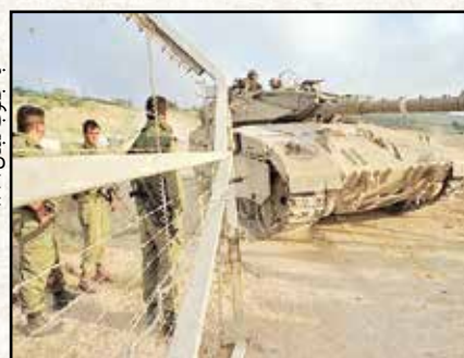
عقب نشینی ارتش اسرائیل در سال ۲۰۰۰ از لبنان

حزب الله در سال ۱۹۹۷ با «عملیات انصاریه» جاسوسان رژیم صهیونیستی را در تله مین گذاری شده گرفتار کرد و اسرائیل نیز برای نخستین بار در عملیات اطلاعاتی شکست را تجربه کرد. در سوم ژوئن ۱۹۹۹ بر اساس قطعنامه ۶۲۵ شورای امنیت سازمان ملل مزدوران آنتوان لحد به فرمان ارتش اسرائیل از جنین در جنوب لبنان به طور یکجانبه بدون گرفتن کمترین امتیازی از حزب الله عقب نشینی کردند