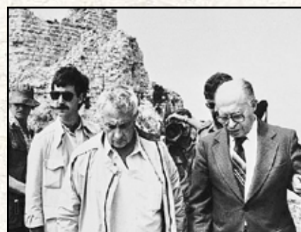
مانجم بگین و آرئیل شارون در قلعه بو فورت، چند ساعت پس از تجاوز اسرائیل به جنوب لبنان ۱۳۶۱