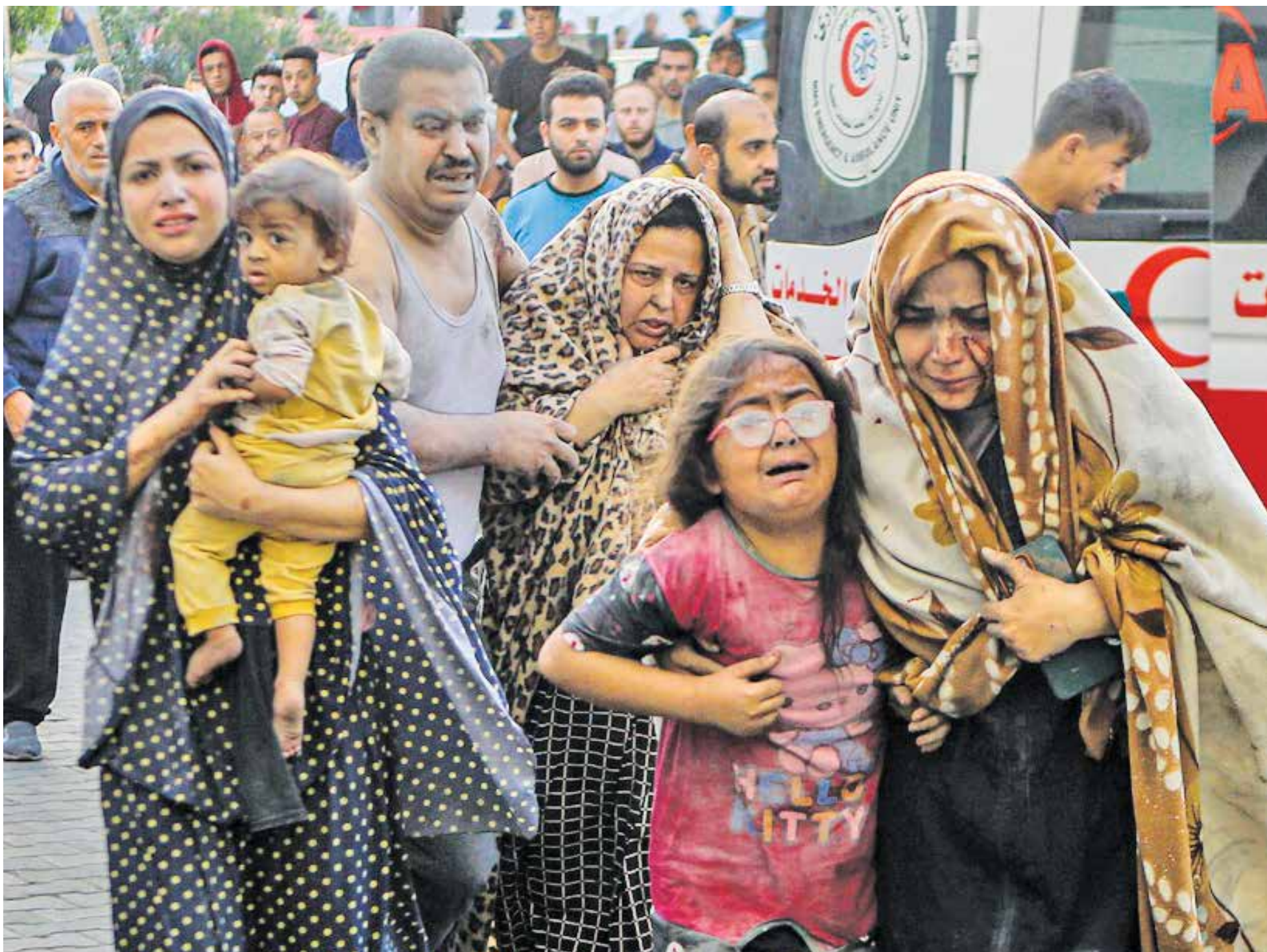
توضیحی برای این عکس نمی‌توان نوشت

۱۲ روز از عملیات جانانه مقاومت حماس با عنوان «طوفان الاقصی» می‌گذرد. ملتی که سال‌ها تحت محاصره و قربانی ظلم و اذیت و آزار رژیم صهیونیستی بوده است، این بار با عزمی جزم به میدان آمده تا با مقاومت و خون خود فریاد مظلومیت تاریخی اش را به جهانیان برساند. بنا بر آخرین آمار ارائه شده از سوی وزارت بهداشت فلسطین، تعداد شهدای غزه به ۳۰۰۰ نفر رسیده است و ۱۲۵۰۰ نفر نیز زخمی شده‌اند. از این تعداد ۹۴۰ تن کودک و ۱۰۳۲ نفر نیز شهدای زن بوده‌اند. همچنین در کرانه باختری نیز ۶۱ فلسطینی به دست نظامیان رژیم غاصب صهیونیستی به شهادت رسیده و ۱۲۵۰ نفر نیز مجروح شده‌اند. این بار دیگر امپراطوری رسانه‌ای حاکم بر دنیا نمی‌تواند صدای مظلومیت این مردم را بایکوت کند و افکار عمومی مردم جهان اجازه سکوت و بی‌تفاوتی به حاکمان خود نخواهند داد. آه مظلومان غزه دامن ظالمان را خواهد گرفت و بی‌تفاوتی نسبت به آه مظلوم، تقاص خواهد داشت.