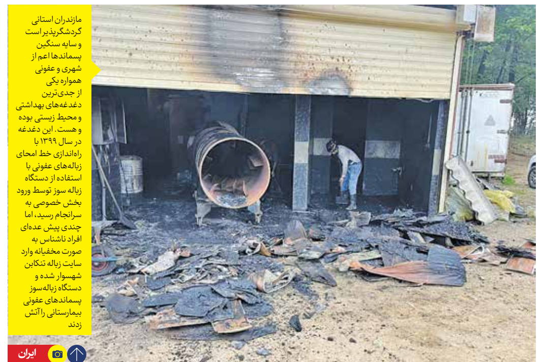
در پی تخریب دستگاه زیاله سوز عفونی سایت زیاله پرده‌سر

آتش زده می‌شوند. رئیس اداره کل محیط زیست تنکابین معتقد است که مشکل خاصی برای زیاله‌های عفونی شهرستان پیش نیامده است. رئیس شورای شهر تنکابین هم می‌گوید که فقط در سیستم سیم‌کشی مشکل پیش آمده و کوره سالم است. این در حالی است که فعالان محیط زیست معتقدند این موضوع، مسأله شخصی نیست، سلامت همه را تهدید می‌کند.