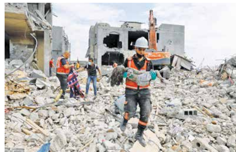
شهید شدن یک کودک بعد از حملات موشکی رژیم صهیونیستی در غزه