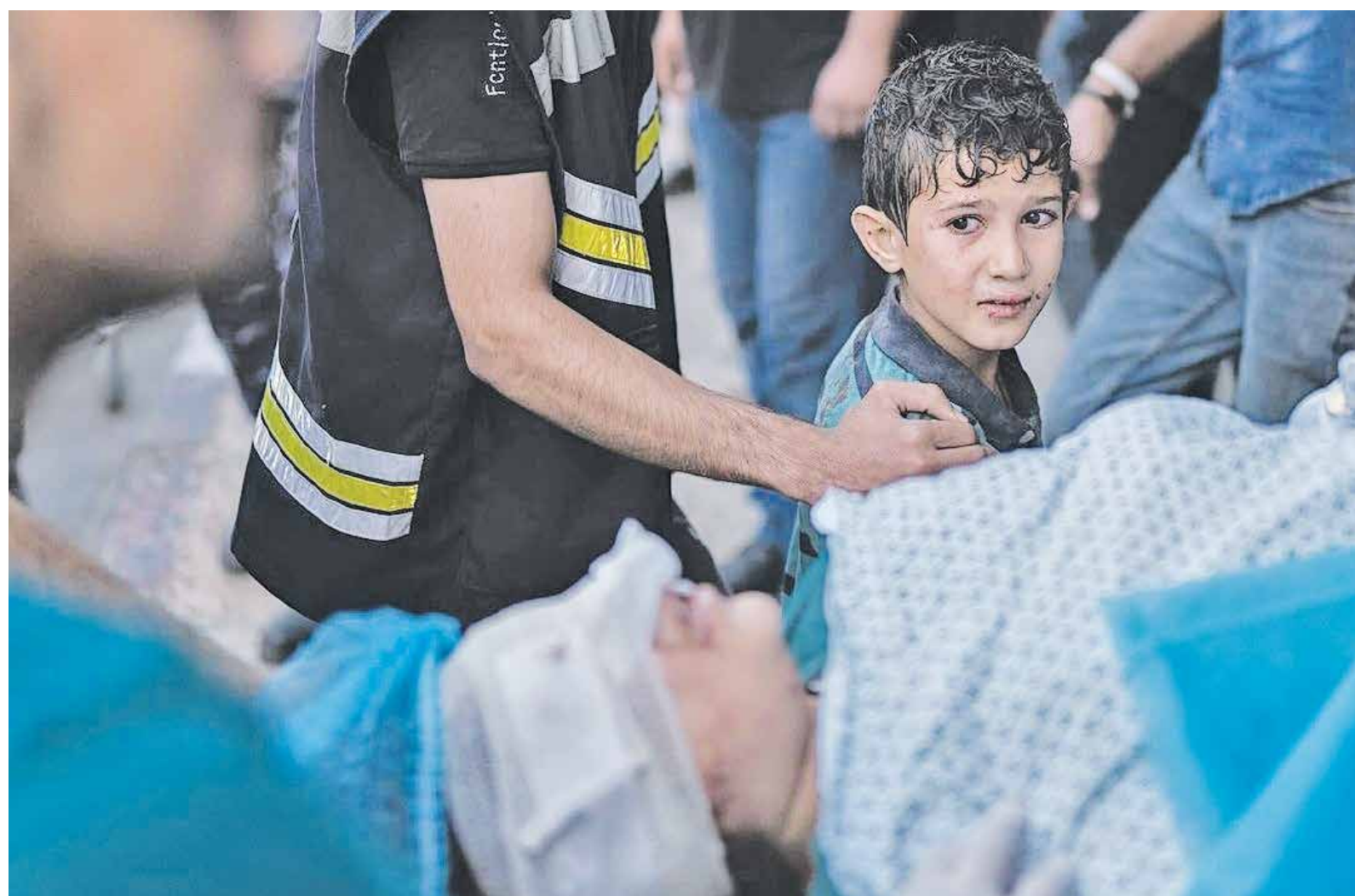
یک کودک فلسطینی در حال نگاه کردن به صورت زخمی مادرش که توسط موشک های رژیم صهیونیستی زخمی شده