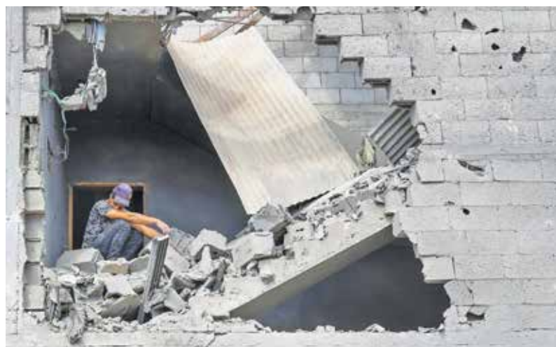
خرابه‌های به‌جا مانده منازل مسکونی در غزه بر اثر اصابت موشک ارتش اشغالگر رژیم صهیونیستی