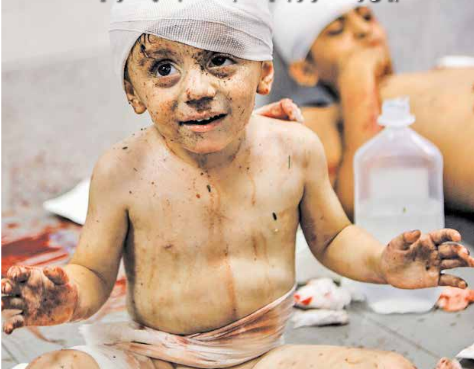
بمباران بیمارستان المعمدانی غزه از سوی ارتش جنایتکار رژیم صهیونیستی و شهادت صدها نفر از مجروحین حملات قبلی

بیش از ۱۵۰۰ نفر در جنایت شب گذشته به شهادت رسیدند