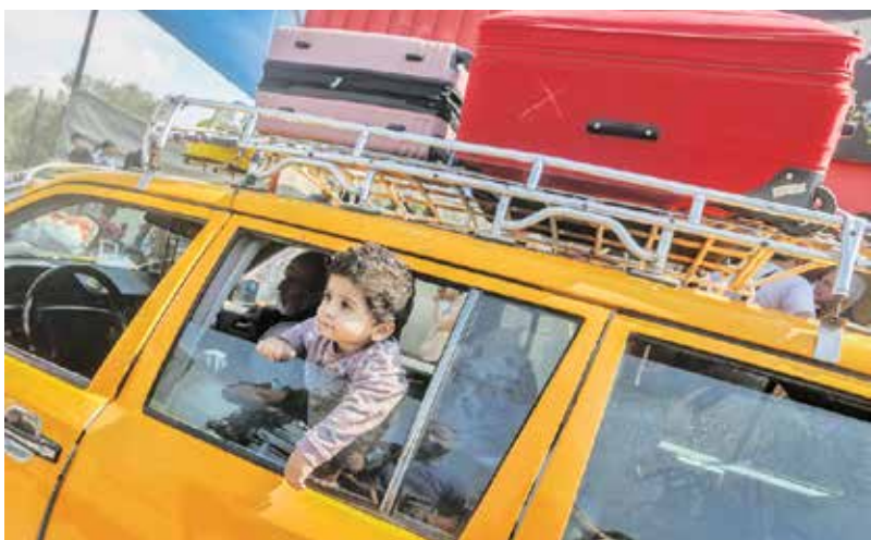
ترک منازل فلسطینی‌ها در غزه بر اثر حملات هوایی رژیم اشغالگر قدس