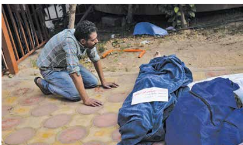
سوگاری یک مرد فلسطینی کنار پیکر عزیزان شهیدش در غزه