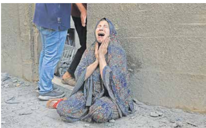
شیون یک زن فلسطینی بعد از موشک باران رژیم صهیونیستی در غزه