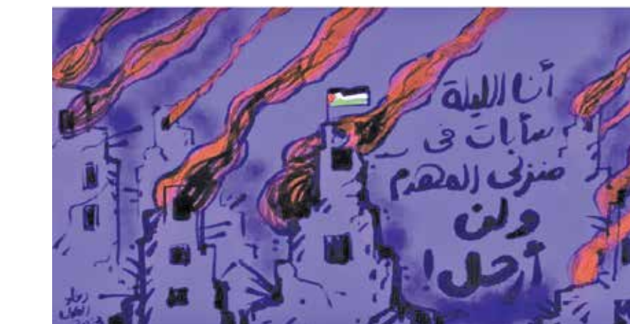
«امشب من در خانه ویرانه‌ام خواهم ایستاد و این سرزمین را ترک نخواهم کرد» اثر خانم دعا العدل هنرمند مطرح مصری