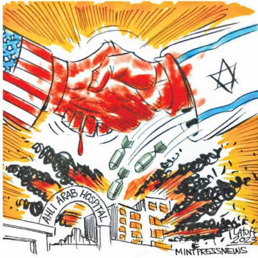
اثر جدید کارلوس لتوف، کارکاتوریست مشهور برزیلی برای جنایت بیماران بیمارستان