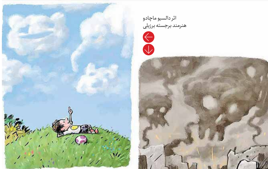
اثر دالسیو ماجادو هنرمند برجسته برزیلی