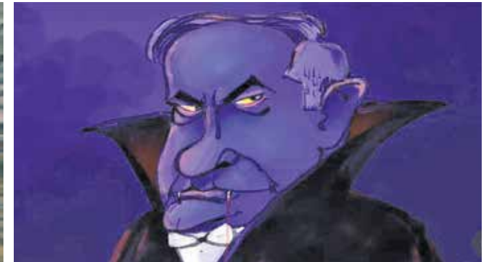
«دنیا نمی تواند نظاره گر این جنایت باشد» اثر کارلوس آموریوم هنرمند سرشناس برزیلی