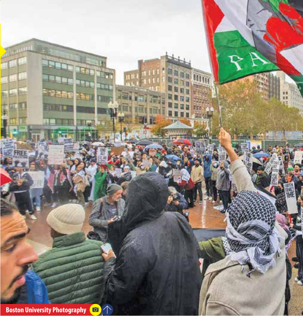
Boston University Photography