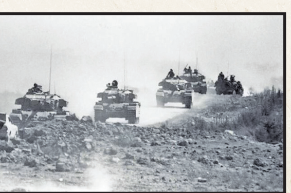
غافلگیری صهیونیست‌ها در جشن ۱۹۷۳

نبردهای پراکنده در سال‌های اول پس از اشغال، نبردهای پراکنده‌ای شکل گرفت که اغلب منجر به گرفتن اسیر مصری و سوری در دو عملیات مختلف در کانال سوئز و بلندی‌های جولان ۱۵ نظامی رژیم اشغالگر را آزاد کرد اما سوریه مدتی بعد چهار اسیری که نزد خود داشت را با ۴۱ سوری که در سال ۱۹۵۶ اسیر شده بودند مبادله کرد؛ و اسیر پنجم صهیونیست در اسارت فوت کرد. تلفات ثبت شده در این سالها شامل ۹۶۷ کشته صهیونیست در عملیات‌های مختلف «فداییان