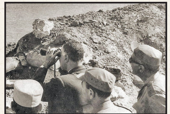
جنگ‌های فرسایشی تا ۱۹۷۰

آزادی چهار سرباز اسرائیلی که در همان جنگ اسیر شده بودند، آزاد کرد. همچنین در ۱۲ دسامبر ۱۹۶۳ رژیم صهیونیستی و سوریه در یک قرارداد مبادله اسیران، ۱۱ صهیونیست را با ۱۵ اسیر سوری مبادله کردند. تلفات اسرائیل ۲۳۱ کشته و ۸۹۹ مجروح بود و حدود ۳۰۰۰ نفر از نظامیان و غیرنظامیان مصری به شهادت رسیدند و ۴۹۰۰ نفر مجروح شدند. ۱۶ انگلیسی و ۱۰ فرانسوی نیز از مجموع حدود ۸۰ هزار نفر نیروی نظامی این کشورها که به حمایت از اسرائیل در جنگ حاضر بودند، کشته شدند.