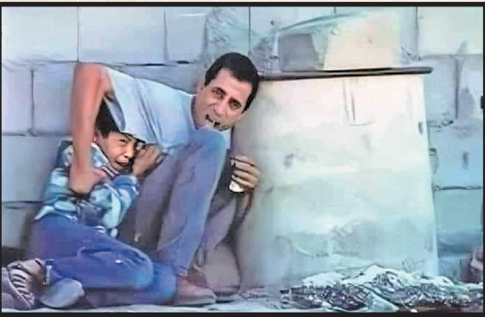
در مجموع مدافعان عرب فلسطین، در جنگ شش روزه ۱۸۳۰۰ شهید دادند در حالی که آمار کشته‌های صهیونیست کمتر از ۸۰۰ نفر بود