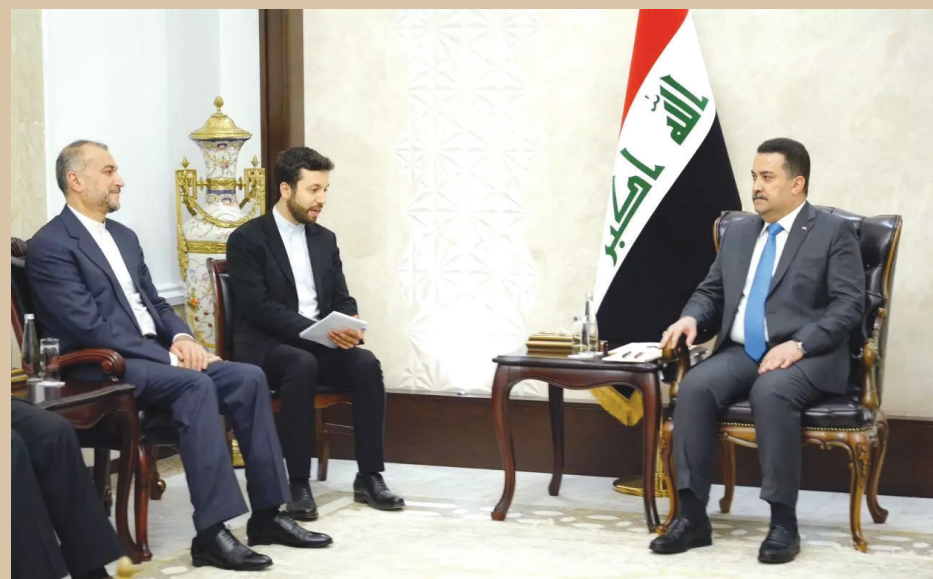
تبادل نظر وزیر امور خارجه با نخست‌وزیر عراق

فعال شدن دیپلماسی منطقه‌ای ایران به نفع ملت فلسطین و عناصر مجاهدش که با رایزنی‌های رئیس‌جمهور و سفر وزیر امور خارجه آغاز شده بود فضای منطقه را با خود همراه کرد و افکار عمومی منطقه بویژه ملت عراق را تحت تأثیر تحولات خونین غزه و جنایات رژیم صهیونیستی قرار داد. برپایی اجتماع بزرگ عراقی‌ها در حمایت از مقاومت فلسطین، صحنه بی‌بدیلی را در همدردی ملت عراق با ملت فلسطین به تصویر کشید که به زعم رسانه‌ها نظیر آن دیده نشده بود.