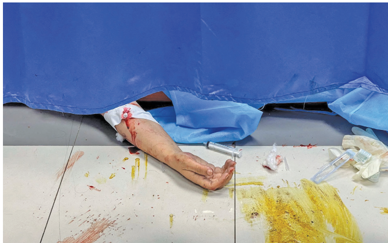
نمایی از یک بیمارستان در غزه