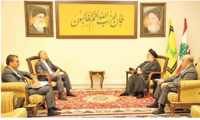
دیدار وزیر امور خارجه با دبیرکل حزب الله لبنان