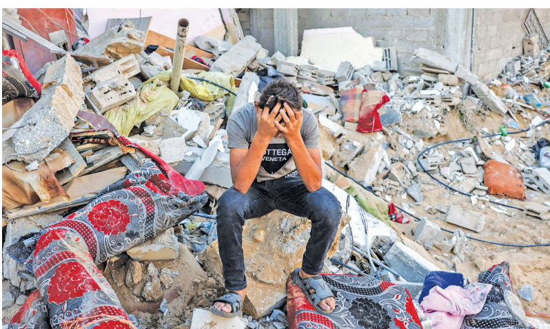
یک نوجوان فلسطینی در کنار خرابه‌های خانه‌اش که بر اثر حملات موشکی رژیم صهیونیستی تخریب شده است.