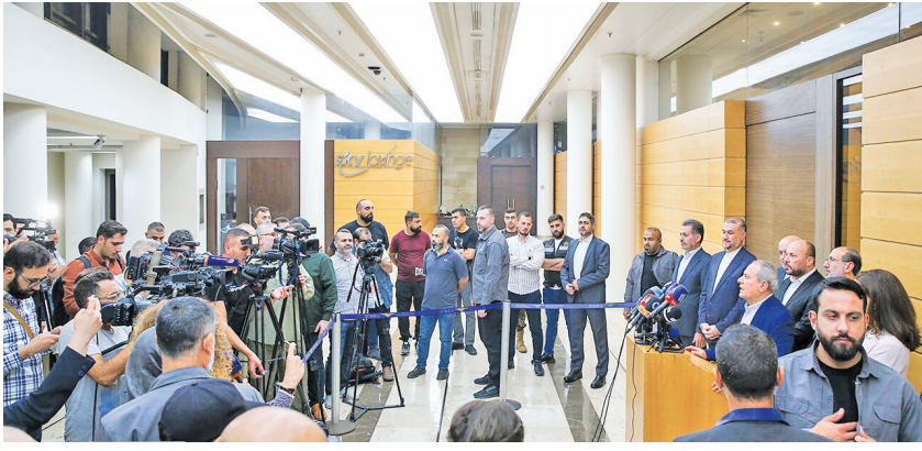
استقبال اعضای گروه های مقاومت از سفر امیر عبداللهیان به لبنان