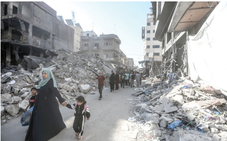
آوارگان فلسطینی در حال ترک محله خود پس از موشک باران شهر غزه توسط رژیم صهیونیستی