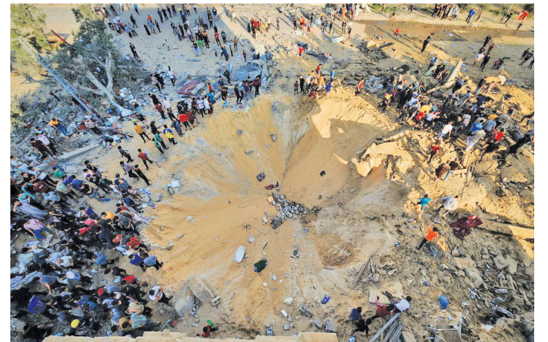
اصابت موشک ارتش صهیونیستی و تخریب یک منزل مسکونی در رفح