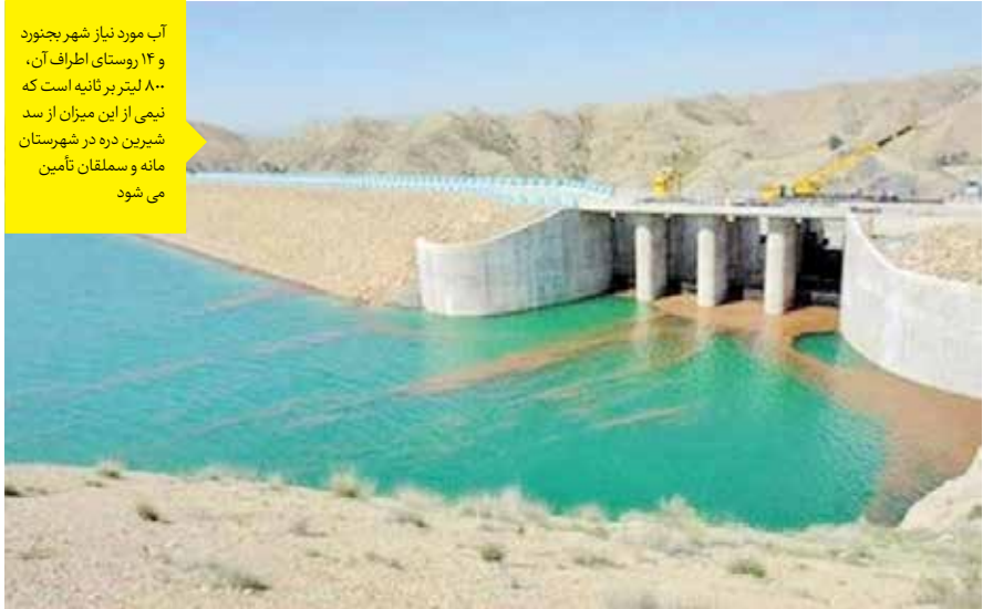
آب مورد نیاز شهر بجنورد و ۱۳ روستای اطراف آن، ۸۰۰ لیتر بر ثانیه است که نیمی از این میزان از سد شیرین دره در شهرستان مانه و سملقان تأمین می‌شود.