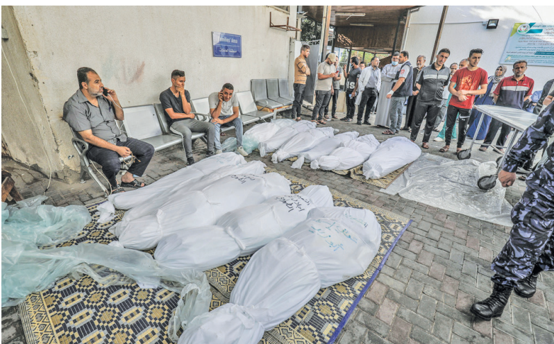
شدهای فلسطینی در حیاط یک منزل مسکونی در غزه