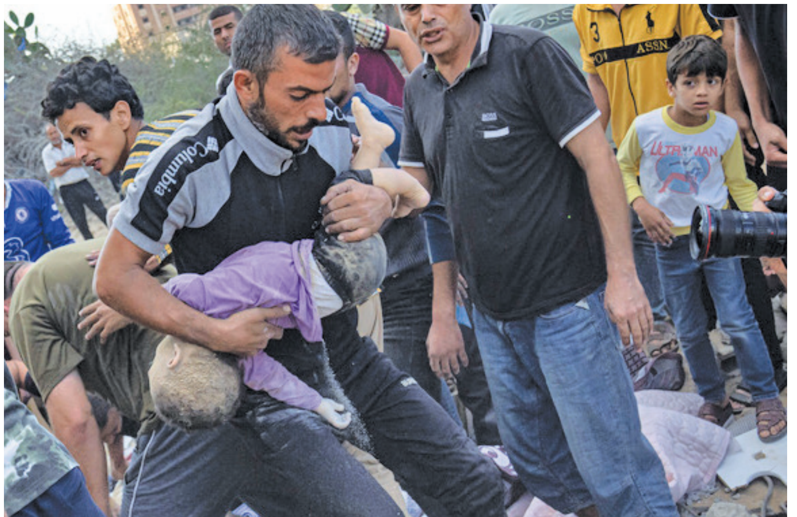
مجروح شدن یک کودک فلسطینی بر اثر اصابت موشک ارتش صهیونیستی و تخریب یک منزل مسکونی در رفح