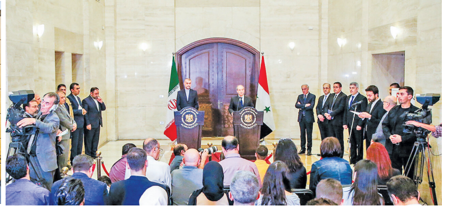
دیدار وزیر امور خارجه ایران با همتای سوری خود