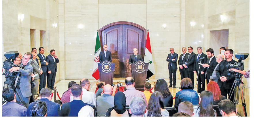
دیدار وزیر امور خارجه ایران با همتای سوری خود