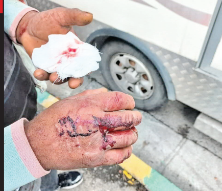
گروه حوادث / سگ های ولگرد با حمله به اعضای یک خانواده در فردیس کرج باعث مجروح شدن آنها شدند.