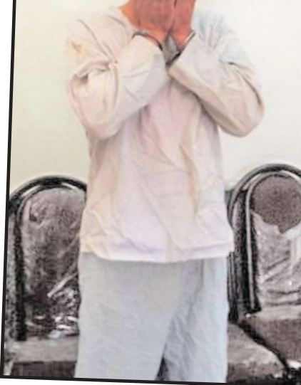
گروه حوادث / پسر جوان که متهم است در یک درگیری دوستش را به قتل رسانده در حالی در دادگاه کیفری یک استان تهران محاکمه شد که مدعی است چاقو ناخواسته به مقتول خورده است.