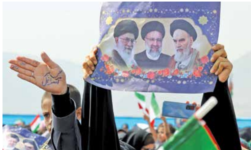
در حاشیه اجتماع باشکوه مردم شهرستان رستم از کابینه هیأت دولت