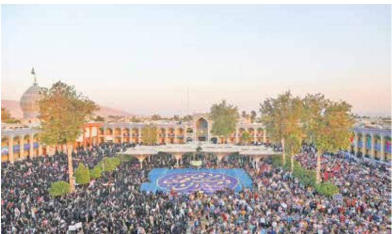
سخنرانی در اجتماع پرشور مردم شیراز