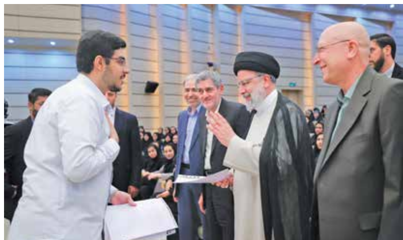
مراسم آغاز سال تحصیلی دانشگاه‌ها و مراکز آموزش عالی سراسر کشور