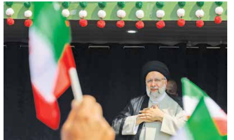
رئیس جمهور در جمع مردم شهرستان رستم