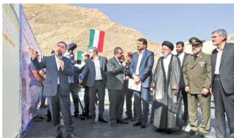
بهره‌برداری از پروژه آزادراه شیراز-اصفهان