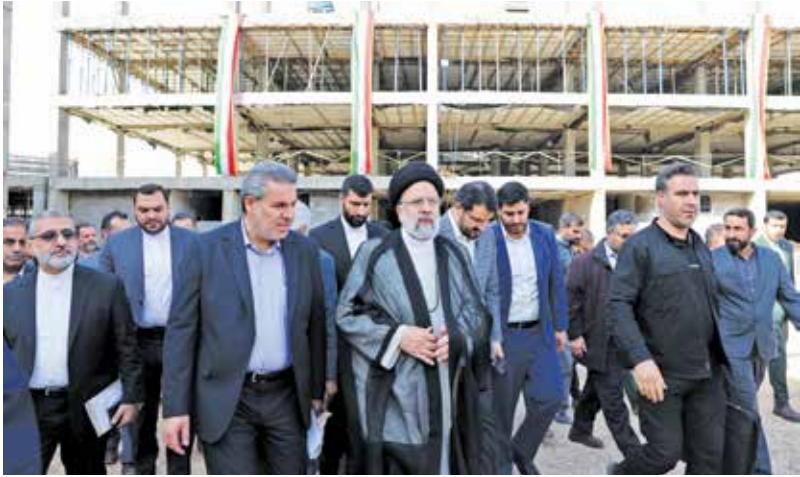
واگذاری ۱۰ هزار و ۲۰۰ واحد مسکونی و ۳۰ هزار قطعه زمین در استان فارس