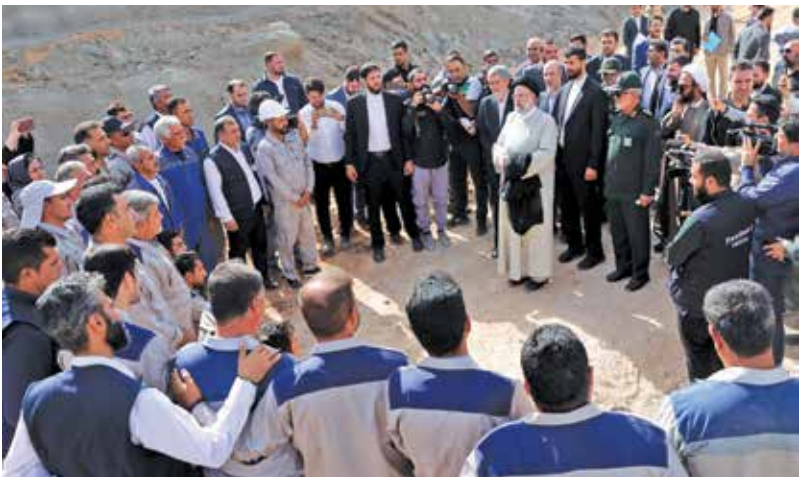
بهره برداری رسمی از طرح عظیم خط دوم انتقال آب شرب کلانشهر شیراز از سد درودزن