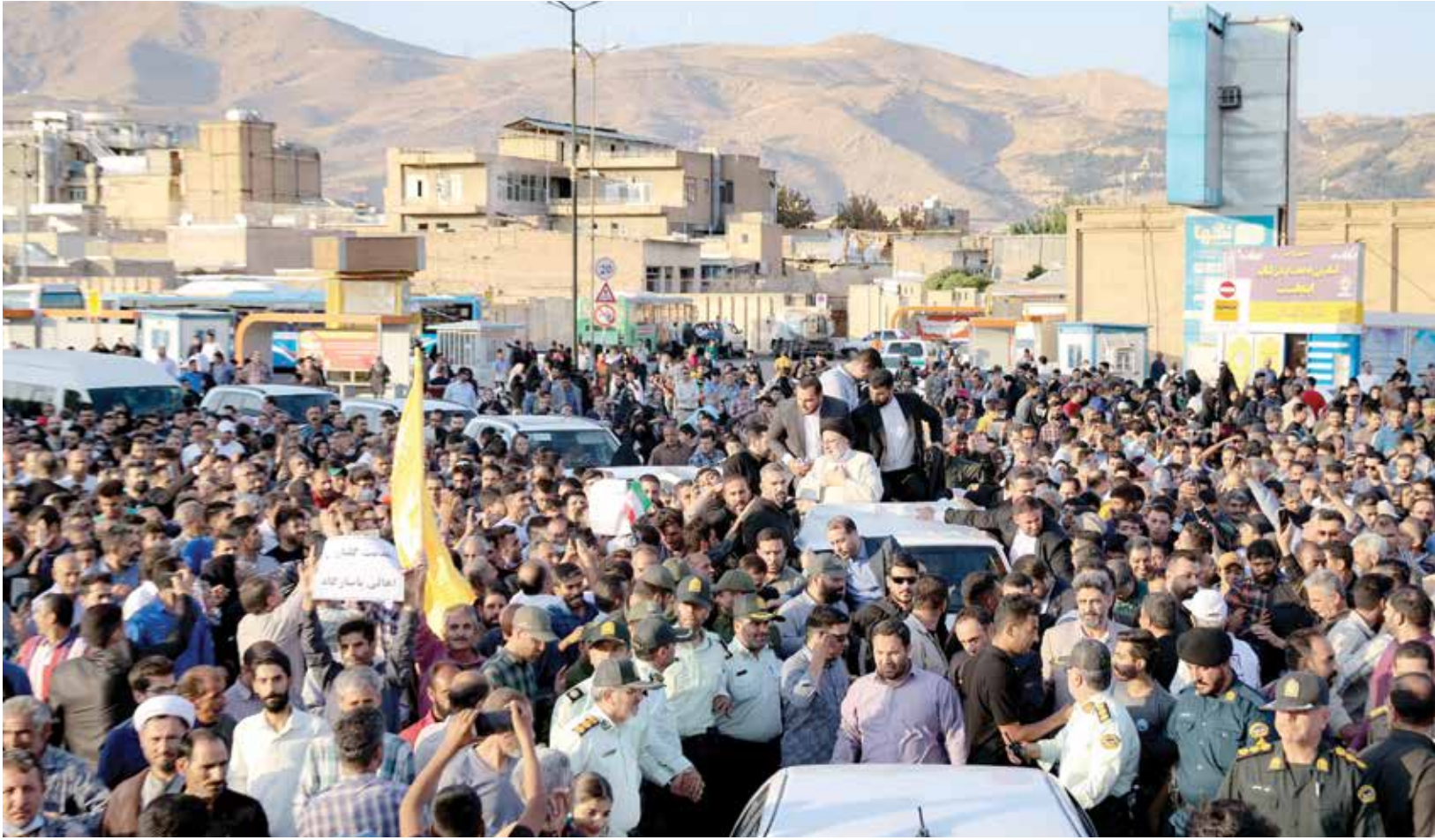
استقبال مردم شیراز از رئیس جمهوری