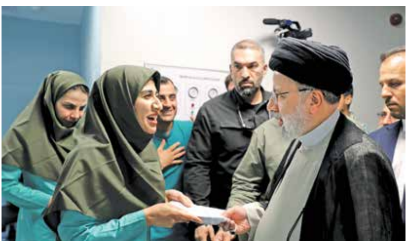
افتتاح دو بیمارستان ۶۴ تختخوابی شهرستان رستم و ۱۶۰ تختخوابی شهرستان فسا