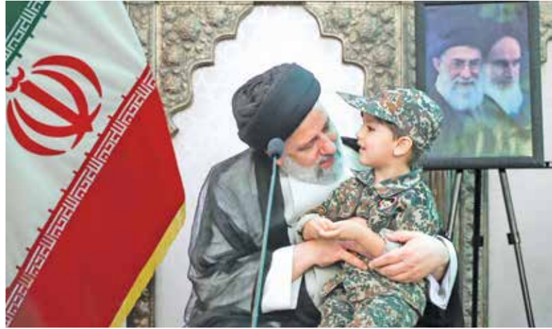
دیدار با خانواده شهدا و جانبازان حوادث تروریستی حرم شاهچراغ