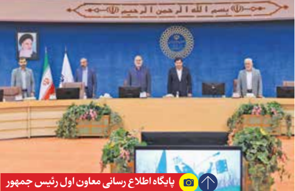
پایگاه اطلاع رسانی معاون اول رئیس جمهور

برشمرد و تأکید کرد: استانداران باید با بازدیدهای سرزده و همچنین تعیین یک نماینده بازرسی در بنادر به‌صورت کامل از حجم کالاها در مبادی ورودی کشور و حجم ذخایر انبارهای گمرکات اطلاع کامل داشته باشند.