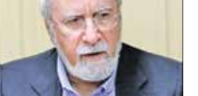
داگلاس شولزمن تحلیلگر بین‌المللی نیویورک تایمز مترجم: زهره صفاری

حمله غافلگیر کننده حماس به اسرائیل آن هم در پنجاهمین سالگرد جنگ روز کپور، ناگهانی اطلاعاتی اسرائیل را به اثبات رساند. در فاصله چند ساعت از آغاز حملات موشکی، شبه نظامیان غزه با عبور از حصار مرزهای جنوبی اسرائیل حتی برج‌های دیده بان منطقه‌ای را نیز غافلگیر کردند. در ادامه عملیات زمینی حماس در مرحله‌های بسیاری بی‌گرفته شد به طوری که حتی خبرنگار تلویزیون غزه نیز حملات را داخل اسرائیل را غیرقابل تصور خواند. در واقع پرواز هزاران موشک در آسمان در طول سال‌ها حملات اطراف غزه، تصویر آشنایی برای ساکنان اسرائیل بود اما دیدن فلسطینیان در خیابان‌ها هرگز پیش از این اتفاق نیفتاده بود.