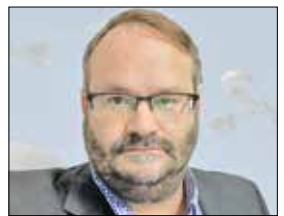
ست جی. فرانتزمان تحلیلگر مسائل خاورمیانه جروزالم پست مترجم: زهره صفاری

تکرار غافلگیری اسرائیل در جنگ روز کپور در سال ۱۹۷۳ دانست اما با این تفاوت که در سال ۱۹۷۳ طرف‌های مبارز تسلیحات جنگی و نیروی متمرکز تا این حد نداشتند و اسرائیل نیز به مراتب از ارتش امروز قوی‌تر بود. از سوی دیگر شلیک موشک‌های حماس به قدس نیز این حمله را منحصر به فرد کرده است. گرچه آنها در گذشته نیز به قدس حملاتی داشتند اما این سطح از عملیات، تاکتیک جدید آنها بود. با تمام این تفاسیر در کل می‌توان به فلسطینیان از عملیات حماس در اکثر عملیات‌های سال‌های اخیر تحسین داشت. تاکتیک جدید آنها در قدس را مورد هدف قرار نمی‌دهد و اکثر عملیات‌های حماس در این منطقه به هدف قرار نمی‌دهد و به طوری که حتی خبرنگار تلویزیون غزه نیز حملات را داخل اسرائیل را غیرقابل تصور خواند. در واقع پرواز هزاران موشک در آسمان در طول سال‌ها حملات اطراف غزه، تصویر آشنایی برای ساکنان اسرائیل بود اما دیدن فلسطینیان در خیابان‌ها هرگز پیش از این اتفاق نیفتاده بود. اما آنچه بیش از اینها این اتفاقات را عجیب و شوکه کننده کرده، آن است که نظارت اسرائیل بر شهرهای فلسطین همواره بسیار پیچیده و فراقبر بوده و در عین حال مهمترین وظیفه بخش‌های اطلاعاتی تل آویو رصد فعالیت‌های حماس به شمار می‌رود. در سال ۲۰۱۴، یکی از اعضای واحد سایبری جنگی اسرائیل در گفت‌وگو با گاردین شهادت می‌افش کرد که نشان از اشراف کامل تل آویو بر کوچک‌ترین تحرکات در فلسطین و مرزهای سرزمین‌های اشغالی داشت. با وجود این برنامه حمله حماس از دید تیم‌های نظارتی اطلاعاتی اسرائیل پنهان ماند و غافلگیری سنگینی را به آنها تحمیل کرد.