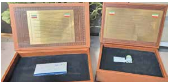
دو محصول دانش بنیان، هدیه قابلیباف به همتای اماراتی

کس بخواهد خللی در امنیت پایدار منطقه و دو کشور وارد کند، قطعاً دشمن مشترک ما و شما خواهد بود. صفرغیاش رئیس مجلس ملی امارات هم با اشاره به نامحدود بودن روابط اقتصادی و تجاری و افق همکاری‌هایی که در این حوزه وجود دارد، یادآور شد: روز گذشته گفت‌وگوهای مهمی شکل گرفت که می‌تواند باعث تعمیق روابط شود که از جمله آن، ادامه اجرای پروژه‌های مشترک میان دو کشور است که باعث اشتغال‌زایی و برقراری صلح، امنیت و ثبات در منطقه می‌شود و امروز روز جریان گذشته‌هایی است که فرصت‌های آن را از دست داده‌ایم. وی از رئیس مجلس شورای اسلامی برای حضور در اجلاس کوپ ۲۸، بیست و هشتمین کنفرانس کشورهای عضو کنوانسیون «چارچوب پیمان‌نامه سازمان ملل برای مسأله تغییرات اقلیمی» که در سال میلادی جاری در اسارات متحده عربی برگزار می‌شود، دعوت رسمی به عمل آورد. رئیس مجلس در این سفر با تاجار و فعالان اقتصادی و مسئولان نهادهای ایرانی در امارات نیز دیدار کرد.