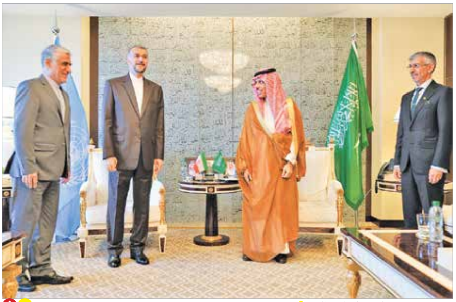
دیدار امیرعبداللّه‌یان و بن فرحان در حاشیه اجلاس اخیر مجمع عمومی سازمان ملل

نوع مواجهه مقام‌های عالی‌رتبه دیپلماتیک ایرانی و سعودی با رویداد اخیر ورزشی نشان داد، نه فوتبال و نه حتی تکانه‌های سیاسی و امنیتی داخلی و خارجی از تلاش خود برای تحقق این هدف دیرینه دست‌نهایی به این هدف را متناثر از رویکردی می‌بیند که در گام نخست ایجاد اخلال و تنش در رابطه ایران و سعودی را هدف قرار می‌دهد. وضعیتی که آنها را برای فرار از مخمصه خودخواسته و آواشته تا طراحی سناریوهایی جدیدی ناظر به برجام‌سازی ادعایی معاطرات امنیتی ایران برای خاورمیانه و موج‌سازی در فضای رسانه‌ای