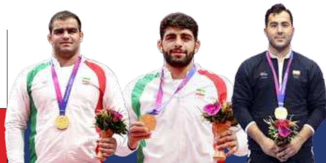
ساروی و میرزازاده درخشیدند، عموزاد ناکام ماند