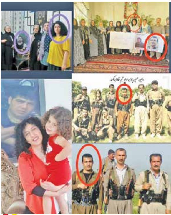
حمایت نرگس محمدی از تروریست‌های مسلح و اشرار در قالب پوشش ادعایی «به نفع اعدام»

بنابراین آنچه که مناسبات ایران و عربستان را با وجود متغیر مداخله‌گری رژیم صهیونیستی و پیشینه سال‌ها قطع روابط و غلبه ادراکات پیشینی، به پیش می‌راند، آن است که مقام‌های دو کشور مانع از آن شوند که این مرادوات نوپا از مسائل سیاسی و اجتماعی اثر گیرد. بویژه آنکه سیاست خارجی جمهوری اسلامی ایران همزمان از فرصت تغییر فضای برآمده از تقویت رابطه ایرانی-عربی به‌خوبی در راستای توسعه روابط منطقه‌ای بهره گرفته و بر لزوم همکاری درون‌منطقه‌ای تأکید ویژه دارد. به همین خاطر ذیل این ملاحظات و محاسبات، این پرسش مطرح می‌شود که در شرایط کنونی کدام سیاست در منطقه به نفع بازگرا است؟ ادامه روند همکاری به منظور رسیدن به یک چهارچوب منطقه‌ای یا تداوم بحران با سناریوهایی تمام‌نشدنی ستیزه‌جویان بیگانه؟