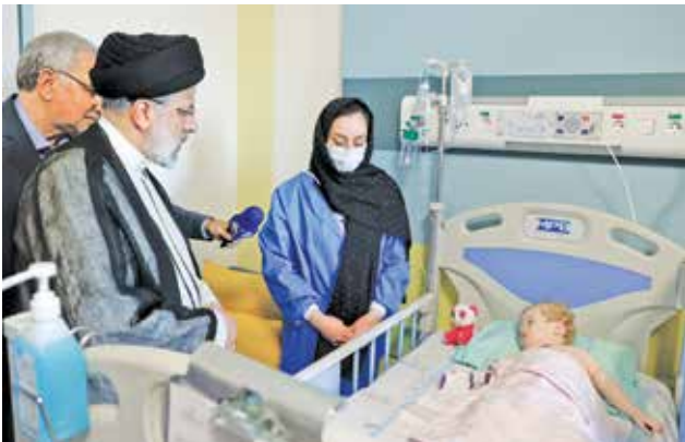
افتتاح بیمارستان تخصصی کودکان حکیم با حضور و سخنرانی رئیس جمهور