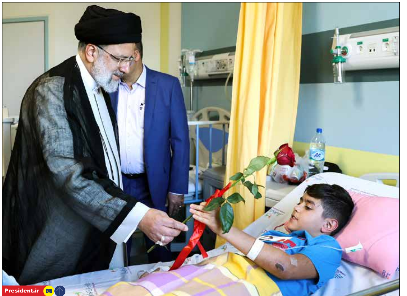
رئیس جمهور بیمارستان کودکان حکیم را افتتاح کرد