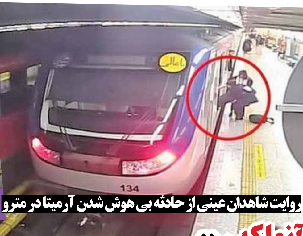
روایت شاهدان عینی از حادثه بی هوش شدن آرمتا در مترو

گروه حوادث/ انتشار کلیپ آزار یک متهم به سرعت با شوکر یک برق در کلانتری زاهدان از سوی سرباز وظیفه منجر به برکناری رئیس کلانتری و برخورد با عاملان این رفتار غیرقانونی شد. در این تصاویر سرباز وظیفه در کلانتری ۱۳ زاهدان با شوکر یک متهم به سرعت را آزار و اذیت و شکنجه کرده بود. پس از انتشار این تصاویر دستور برخورد با سرباز و دیگر افرادی که در این اقدام غیرقانونی حضور داشتند از سوی سردار دوستعلی جلیلیان فرمانده انتظامی استان سیستان و بلوچستان صادر شد و رئیس کلانتری زاهدان نیز به علت