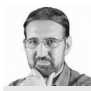
علی الله سلیمی نویسنده و منتقد ادبی