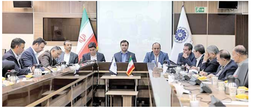
نابید از کشورهای همسایه در مسأله گردشگری عقب بمانیم