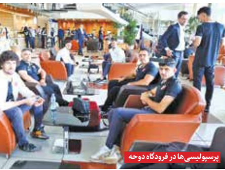
پرسپولیس‌ها در فردگاه دوچه

ترک اردوی تیم ملی ایران در هانگژو به مقصد قطر، توسط سه بازیکن پرسپولیس برای همراهی این تیم مقابل الدحیل، حواشی زیادی را به وجود آورده است. با اینکه مسئولان پرسپولیس در این خصوص مدعی هستند با مهدی تاج رئیس فدراسیون فوتبال هماهنگ کرده بودند اما رضا