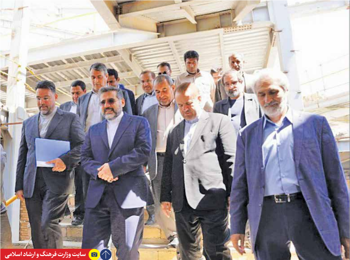
سایت وزارت فرهنگ و ارشاد اسلامی