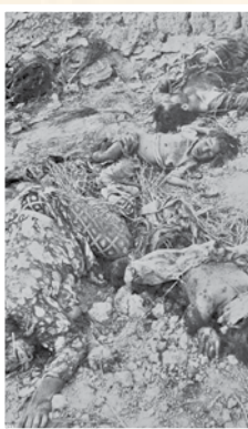
بیکر اعضای یک خانواده که در جریان بمباران هوایی آبادان به شهادت رسیده‌اند.