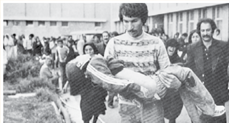
بمباران مدرسه در خرمشهر.

منابع خبرگزاری فارس سایت فرارو خبرگزاری ایرنا پرتال امام خمینی