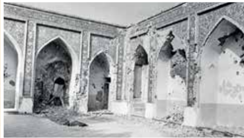
بمباران اردوگاه مهاجرین کرد عراق در زیوه.