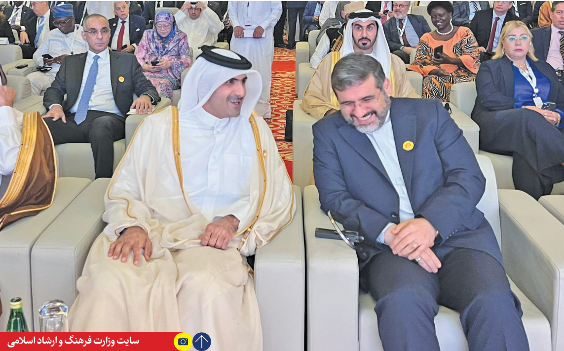
سایت وزارت فرهنگ و ارشاد اسلامی