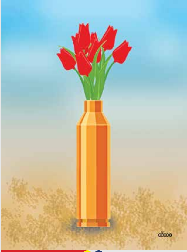
نیما شاه‌میری / طراح و کارتون‌نویست