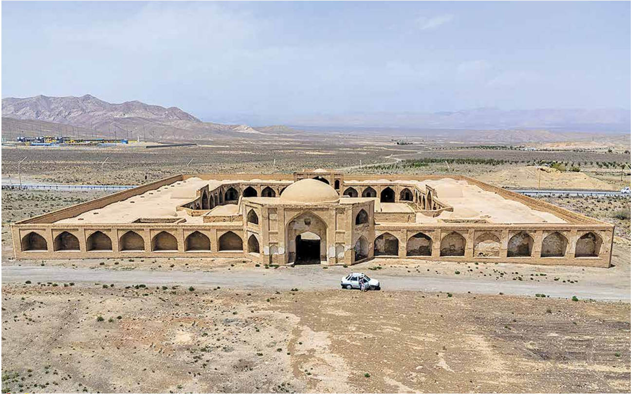
عکس: صدا و سیما ● کاروانسرای آهوان سمنان

انتخاب شهرهای مسیر جاده ابریشم به عنوان پایتخت، امکان معرفی جاذبه‌ها و پتانسیل‌های پایتخت انتخابی را به سایر کشورهای مسیر جاده ابریشم می‌دهد و به ایجاد محصولات مشترک گردشگری می‌شود