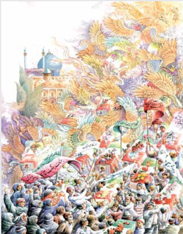
محمدعلی پدرا لسماء / نقاش و نگارگر