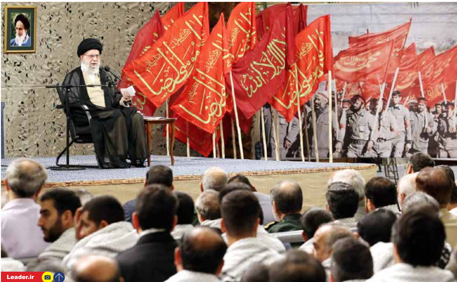
رهبر انقلاب در دیدار هزاران نفر از طلایه داران و فعالان حوزه های مختلف دفاع مقدس:

روز گذشته در پی کاهش تنش ها بین باکو و ایروان با میانجیگری کرمین، وزارت دفاع روسیه اعلام کرد، در پی تماس ها با جمهوری آذربایجان و نمایندگان جمعیت ارمنی قره باغ به توافق بر سر آتش بس رسیدند.