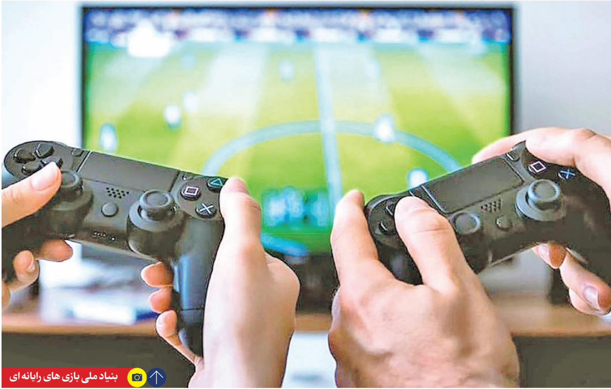
بنیاد ملی بازی های رایانه ای