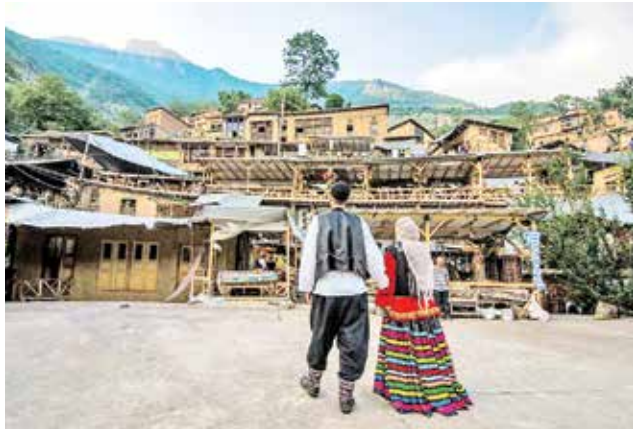
اسلامی ماسوله بود.

ارزیابی میدانی پرونده ماسوله از سوی شورای جهانی بافت‌ها و بناهای تاریخی (ایکوموس) در تابستان ۱۴۰۱ توسط کارشناس اعزامی یونسکو انجام شد. گزارش ارزیاب یونسکو نیز حا از جنبه‌های مثبت بود