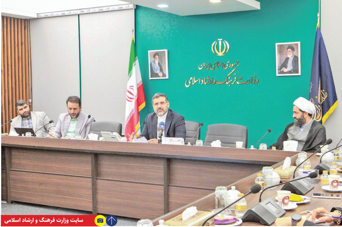
سایت وزارت فرهنگ و ارشاد اسلامی

وزیر فرهنگ و ارشاد اسلامی در این نشست از توافق وزارت ارشاد با صندوق مشترک بازی‌سازان خبر داد و گفت: فعالان حوزه فرهنگ و هنر خبر داد و گفت: هم‌چون پهلوانان نامدار ایرانی مثال‌زدنی، رایانه‌ای از این تسهیلات بهره‌مند خواهند