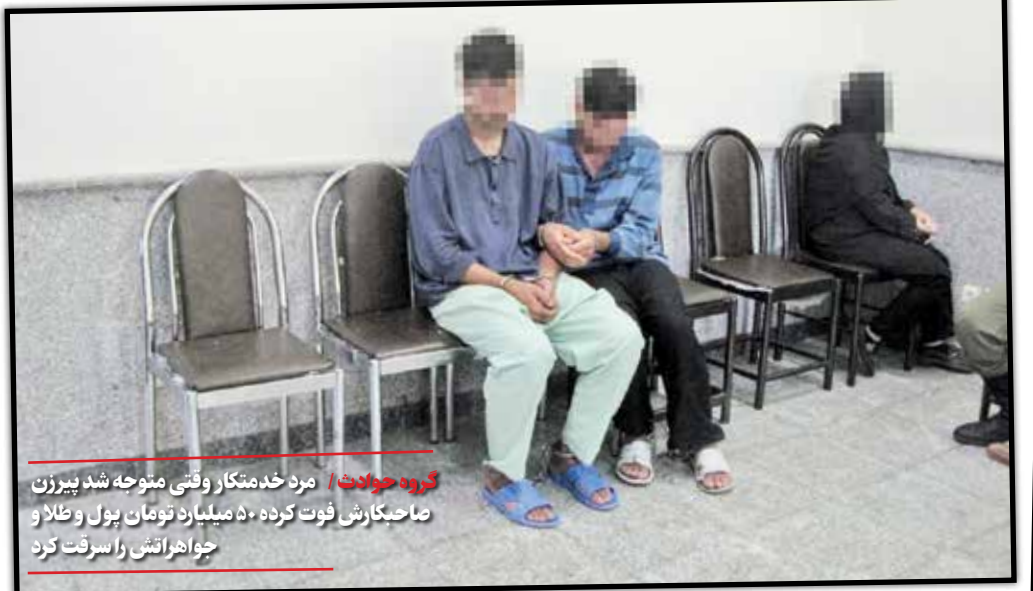
گروه حوادث / مرد خدمتکار وقتی متوجه شد پیرزن صاحبکارش فوت کرده ۵۰ میلیارد تومان پول و طلا و جواهراتش را سرقت کرد.

پلیس راز مرگ وی در خانه ویلایی اش را فاش کرد. وقتی مأموران به محل رفتند مشخص شد چند روز از مرگ وی می‌گذرد