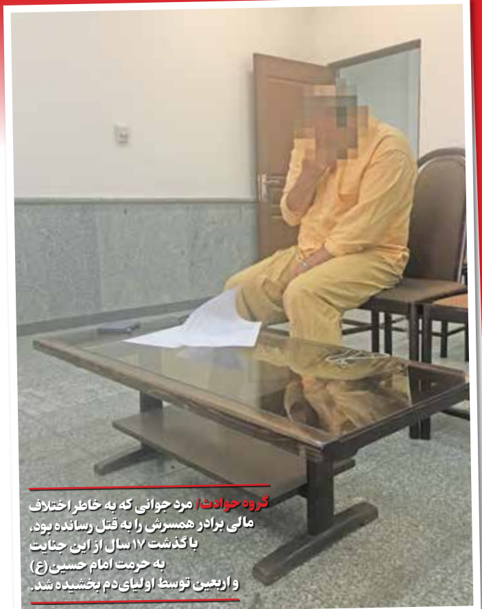
گروه حوادث/ مرد جوانی که به خاطر اختلاف مالی برادر همسرش را به قتل رسانده بود، با گذشت ۱۷ سال از این جنایت به حرمت امام حسین (ع) و اربعین توسط اولیای دم بخشیده شد.

به گزارش خبرنگار «ایران»، رسیدگی به این پرونده از ۱۰ تیر سال ۸۵ و به دنبال گزارش درگیری خونینی مقابل مغازه‌ای در منطقه قلعه‌میر شهرستان بهارستان استان تهران به پلیس گزارش شد. مأموران کلانتری و اورژانس راهی محل شدند و مرد مصدوم به بیمارستان منتقل اما لحظاتی بعد با وجود تلاش کادر درمان تسلیم مرگ شد. به دنبال مرگ مرد جوان، تیم جنایی راهی محل شد و تحقیقات ادامه یافت. در بررسی‌های اولیه، کارآگاهان به بازبینی دوربین‌های مداربسته اطراف محل جنایت و تحقیق از شاهدان پرداختند. دوربین‌ها تصاویر درگیری را ضبط کرده بودند و بدین ترتیب چهره عامل جنایت به دست آمد که نشان می‌داد دو مرد با هم درگیر شده و یکی از آنها با شکستن شیشه نوشابه به دیگری حمله کرده و طرف مقابل که عامل این جنایت بود با چاقو حمله کرده و پس از مجروح کردن مرد جوان از محل متواری شده است.