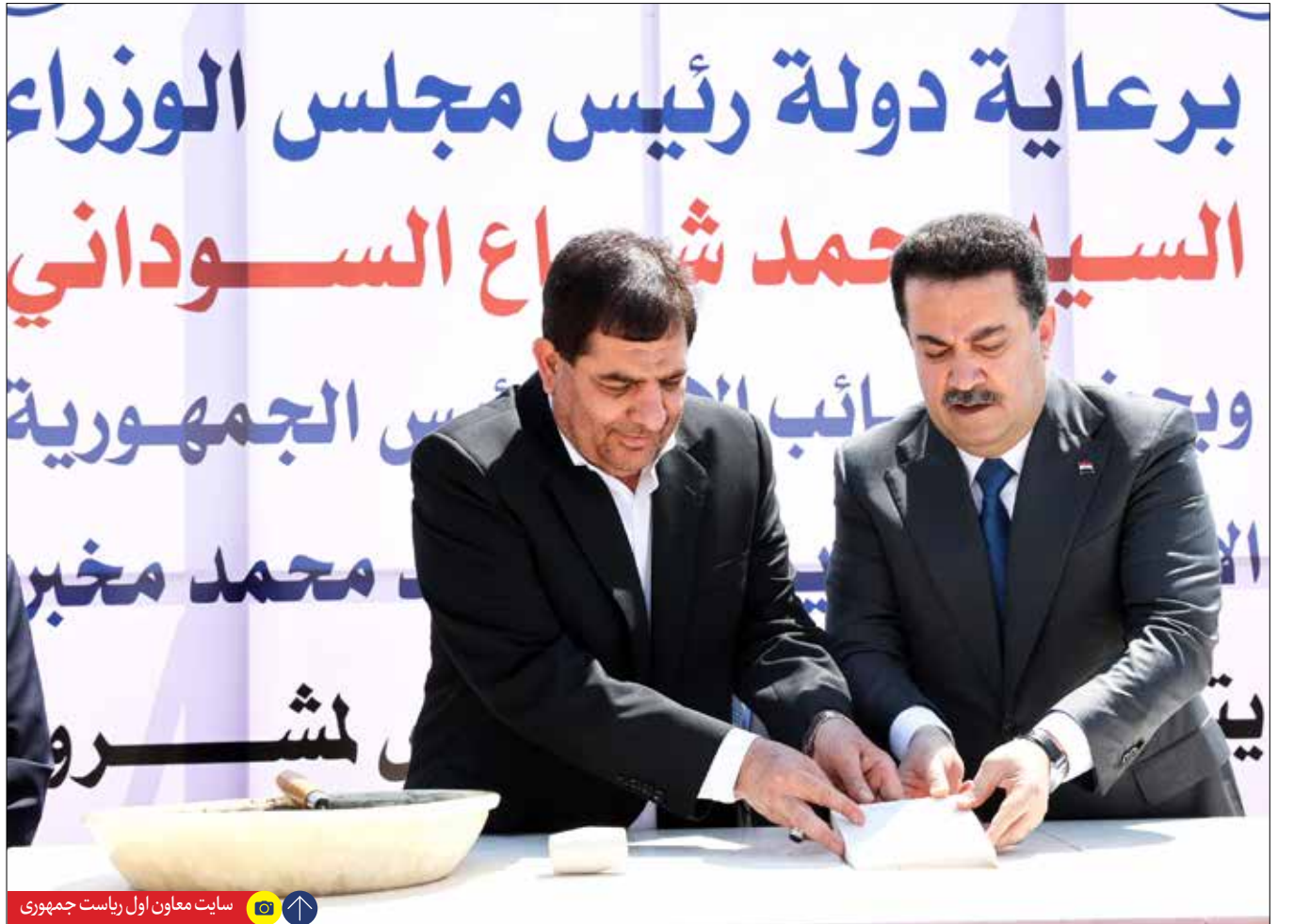
سایت معاون اول ریاست جمهوری

آماده تر از هر سال در خدمت زائران حسینی هستیم