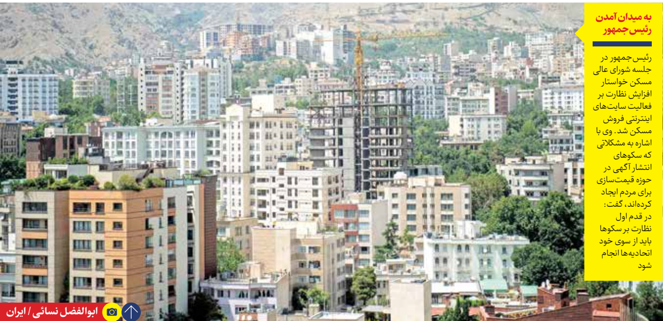
ابوالفضل نسائی / ایران

رئیس جمهور در جلسه شورای عالی مسکن خواستار افزایش نظارت بر فعالیت سایت‌های اینترنتی فروش مسکن شد. وی با اشاره به مشکلاتی که سکوها می‌انتشار آگهی در حوزه قیمت‌سازی برای مردم ایجاد کرده‌اند، گفت: در قدم اول نظارت بر سکوها باید از سوی خود اتحادیه‌ها انجام شود.