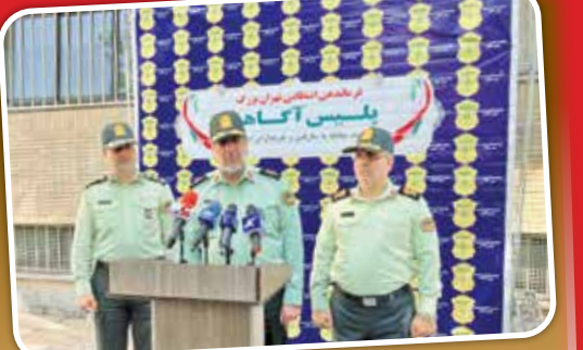
گروه حوادث - مرضیه همایونی / در پی هفته‌ها کار شبانه‌روزی و در جریان چندین عملیات پلیس آگاهی در نقاط مختلف پایتخت، ۱۶۴ متهم به سرقت و خریداران اموال مسروقه دستگیر شدند

به گزارش «ایران»، سردار عباسعلی محمدیان فرمانده انتظامی تهران بزرگ با بیان اینکه این افراد در عملیات جداگانه و در نقاط مختلف شهر تهران دستگیر شده‌اند، گفت: عملیات پلیس برای دستگیری برخی از این افراد بسیار پیچیده و حساس بود، چرا که ما این افراد را در خیابان دستگیر نکردیم، بلکه گروهی از کارآگاهان پلیس آگاهی در این مجموعه پس از ساعت‌ها و روزها کار شبانه‌روزی نسبت به دستگیری این افراد اقدام کردند. پیش از یک‌هزار گوشی تلفن همراه هوشمند، اموال مربوط به سرقت از منازل، چندین دستگاه خودرو و موتورسیکلت مسروقه و... در این طرح کشف شده است.