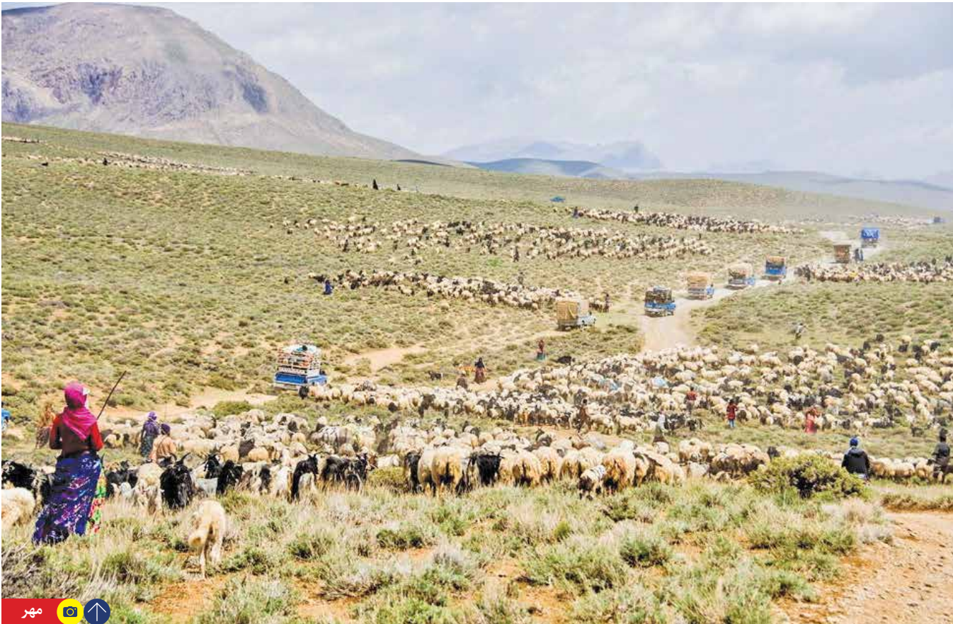
اطلس مراتع کشور در هفت استان از اول مهرماه به اجراء می‌آید