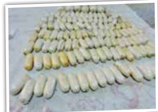
پلیس شبانه‌روز در حال خدمت‌رسانی به شهروندان بوده و به هیچ عنوان اجازه نخواهیم داد عده‌ای قانون‌گریز به اهداف شوم خود برسند.

شناسایی کرده و متهمان را به صورت نامحسوس تحت رصد و کنترل خود قرار دادند. مأموران پلیس مبارزه با مواد مخدر در شهرستان اصفهان در نهایت در یک عملیات هماهنگ و ویژه پلیسی هر ۴ متهم را دستگیر و ۴۴۱ بسته مواد مخدر به میزان ۴ کیلو و ۲۱۰ گرم هروئین را از معده قاچاقچیان که به روش بلع در حال انتقال آن بودند، استخراج و کشف کردند. سرهنگ نیکبخت در پایان با اشاره به اینکه متهمان پس از تشکیل پرونده برای انجام اقدامات قانونی به مرجع قضایی تحویل داده شدند خاطر نشان کرد: