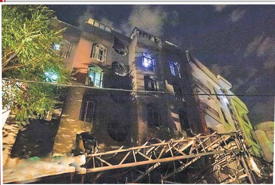
گروه حوادث / حکم مقصران حادثه آتش سوزی کلینیک سینا اطهر که منجر به مرگ ۱۹ تن اعم از پزشک، کادر درمان و بیمار شد برای اجرا به دادسرای امور جنایی تهران ارجاع شد.

به گزارش خبرنگار حوادث «ایران»، دهم تیر سال ۹۹ انفجار و آتش سوزی هولناکی در یک مرکز پزشکی واقع در خیابان شریعتی تهران نرسیده به میدان تجریش، رخ داد. حادثه مرگباری که مرگ ۱۵ زن و ۴ مرد را رقم زد. به دنبال این آتش سوزی، پرونده‌ای در دادسرای امور جنایی تهران تشکیل شد و با تشکیل هیأت کارشناسی بررسی‌ها برای شناسایی مقصران پرونده ادامه یافت. در نهایت تیم کارشناسی اعلام کرد مؤسسان و هیأت مدیره شرکت خدمات پزشکی، جراحی سینا مبین شمیرانات، وزارت بهداشت، دانشگاه شهید بهشتی، شهرداری، آتش نشانی و سازمان‌های مرتبط دیگر در این ماجرا مقصر بوده و میزان قصور هر یک از مقصران نیز مشخص شد. بدین ترتیب کیفرخواست برای ۳۱ متهم حقوقی و حقیقی پرونده صادر شد و متهمان در شعبه ۱۰۵۸ مجتمع قضایی کارکنان دولت پای میز محاکمه رفتند. در نهایت متهمان به دفاع از خود پرداخته و رأی دادگاه صادر شد اما با اعتراض متهمان، پرونده به شعبه تجدیدنظر ارجاع شد و با صدور رأی دادگاه تجدیدنظر، پرونده برای اجرای حکم به دادسرای امور جنایی تهران ارجاع شد.