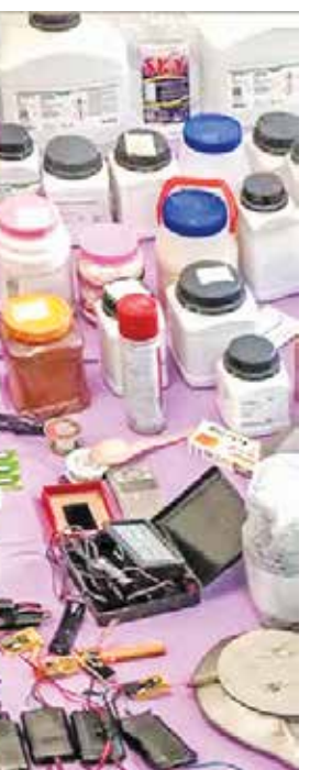
کشف محموله‌های انفجاری

راهبرد دیگر دشمن برای بی‌ثبات‌سازی ایران، قاچاق سلاح گرم به کشور از مبادی مرزی است که فقط در سه ماهه نخست آشوب پاییزی ۱۴۰۱ طبق اعلام فرماندهی انتظامی، بالغ بر ۱۰ هزار قبضه اسلحه گرم-بازداشت و نیمه‌سنگین-وارد کشور شد. وزارت