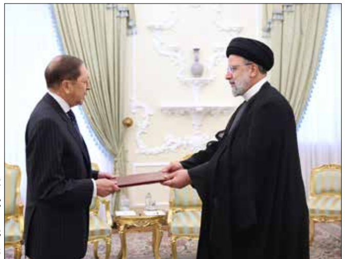
تقدیم اسطوانه سبزه سمنگ