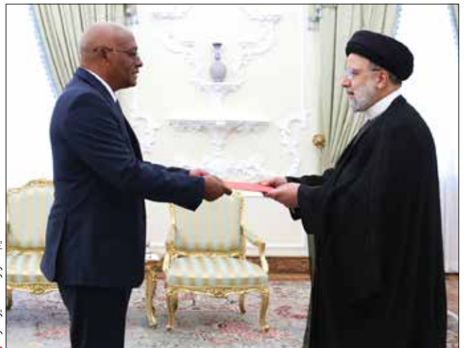
تقدیم اسطوانه سبزه سمنگ