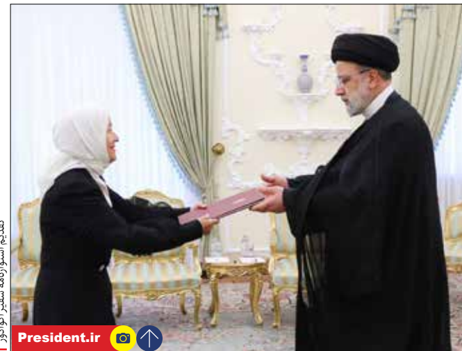
تقدیم اسطوانه سبزه سمنگ