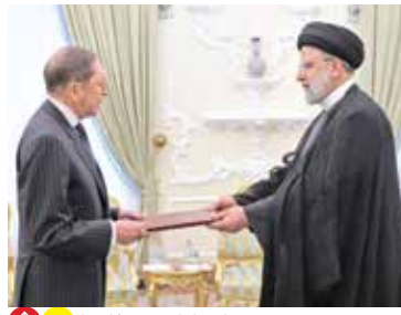
تقدیم استوارنامه سفیر کلمبیا