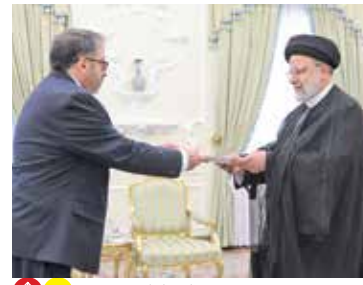
تقدیم استوارنامه سفیر پرو

سفیر جمهوری آنگولا نیز اظهار کرد: من از طرف جمهوری آنگولا دستور کار واضح و مشخصی برای تلاش در راستای گسترش همکاری‌ها با ایران دارم.