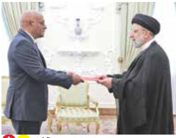
تقدیم استوارنامه سفیر آنگولا