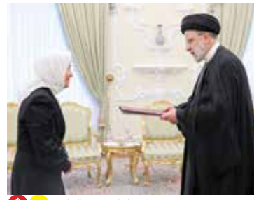
تقدیم استوارنامه سفیر اکوادور