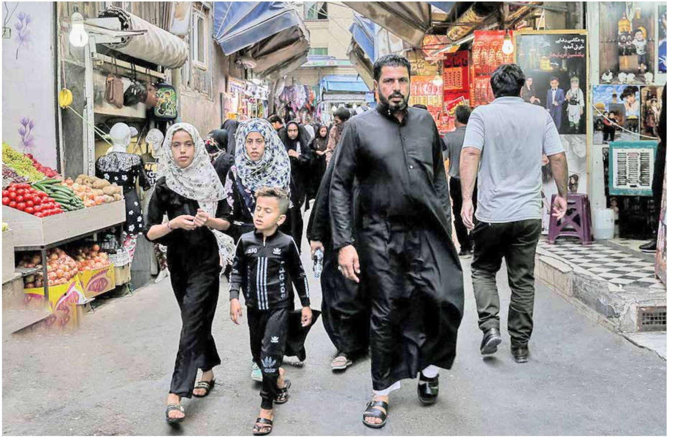
به دنبال افتتاح کنسولگری عربستان در مشهد

فعالان گردشگری اعتقاد دارند که حضور دوباره عربستانی‌ها و افزایش فرهنگی ایران به بازگشت گردشگران و کشور عربی منطقه منجر می‌شود