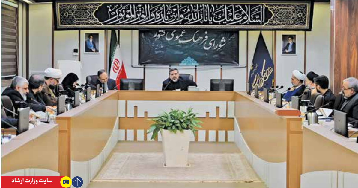
سایت وزارت ارشاد

وزیر فرهنگ و ارشاد اسلامی در جلسه شورای فرهنگ عمومی کشور عنوان کرد