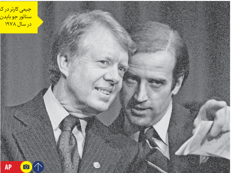
جیمی کارتر در کنار سناتور جو بایدن در سال ۱۹۷۸

۴۴ سال بعد از آن زمان، آمریکا همان قدر ملتیب بود که در پیش درآمد انتخابات سال ۱۹۷۶ مشاهده شده بود. دونالد ترامپ قدرت را در دست گرفته و همه چیز را در هم می‌کوبید و به پیش می‌رفت و کشور از این طریق به یک نقطه عدم اطمینان