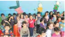
حدود ۹۰۰ هزار نفر از کودکان ۵ الی ۶ ساله در حال گذراندن دوره پیش دبستانی یک ساله هستند

بر اساس آمار سازمان تعلیم و تربیت کودک، حدود ۹۰۰ هزار نفر از کودکان ۵ الی ۶ ساله در حال گذراندن دوره پیش دبستانی یک ساله هستند. امسال اولین سالی است که قرار است کودکان‌ها با مجوز سازمان تعلیم و تربیت، فعالیت خود را آغاز کنند. این در حالی است که همچنان بسیاری از خانواده‌ها از نبود محتوای واحد برای آموزش در این دوره انتقاد دارند.