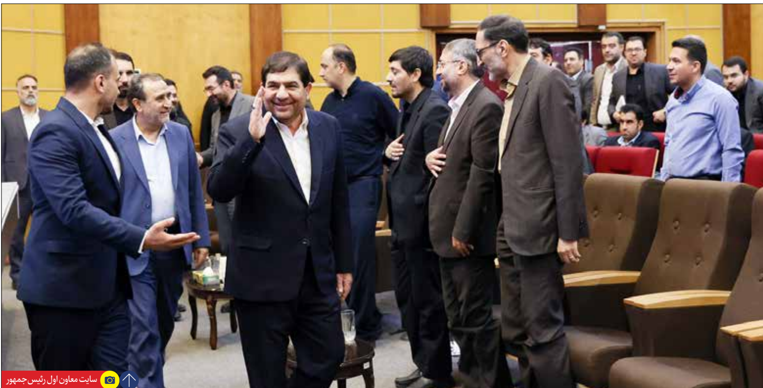
سایت معاون اول رئیس جمهور

فاز ۱۱ پارس جنوبی رکورددار طولانی‌ترین پروژه نفتی است که دولت سیزدهم در دوسال آن را از انزوای مطلق خارج کرد