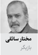
مختار ساتقی بازیگر