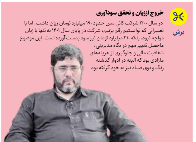
خروج ارزبان و تحقق سودآوری