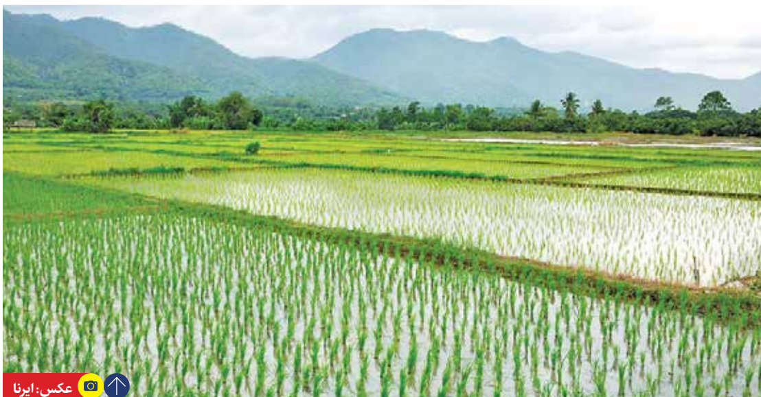
کشورهای کاشت بدون استفاده از آفت‌کش‌ها