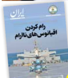
ویژه‌نامه سفر ناوگروه ۸۶ را در سایت روزنامه ایران بخوانید

حضور دریایی ایران در مناطق دوردست و اقیانوس‌های آرام و اطلس، حضوری امنیتی‌ساز برای کشور است