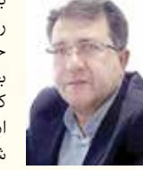
کل بازرسی کار قرار دارد.

طبق گفته مسئولان وزارت تعاون، کار و رفاه اجتماعی علت ۷۰ درصد حوادث ناشی از کار شرایط ناایمن و ۳۰ درصد آن بی‌احتیاطی فردی است. این امر نشان از عدم تعهد برخی کارفرمایان نسبت به کارکنانشان در حوزه ایمنی محیط کار دارد که برای جلوگیری از این امر یعنی فراهم آوردن شرایط محیطی مناسب برای کارگران نیاز است بازرسی‌های مکرر از واحدهای تولیدی، کارگاه‌های ساختمانی و کارخانجات صورت گیرد تا کارفرمایان مجاب شوند شرایط را طبق اصول و ایمنی کار برای کارکنانشان فراهم سازند. به گفته مدیرکل بازرسی کار و وزارت تعاون، کار و رفاه اجتماعی، اداره کل بازرسی کار آماده هر گونه همکاری برای ارتقای ایمنی کارگاه‌ها در تمام نقاط کشور است و در این راستا از تشکلات کارگری و کارفرمایی درخواست می‌کند سهم خود را در کاهش حوادث با تأمین شرایط کار ایمن، آموزش و نظارت توسط کارفرمایان و همچنین رعایت موارد ایمنی توسط کارگران ایفا کنند. ناگفته نماند این اداره کل سال گذشته در راستای رفع نواقصی که منجر به آسیب شغلی می‌شوند تعداد ۴۲۰ هزار بازرسی از کارگاه‌های کشور و صدور ۳۶۰ هزار ابلاغیه رفع