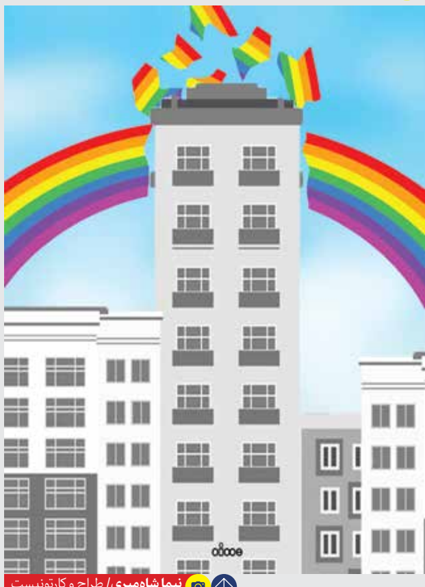
نمایا شاه‌میری / طراح و کارتون‌نویست