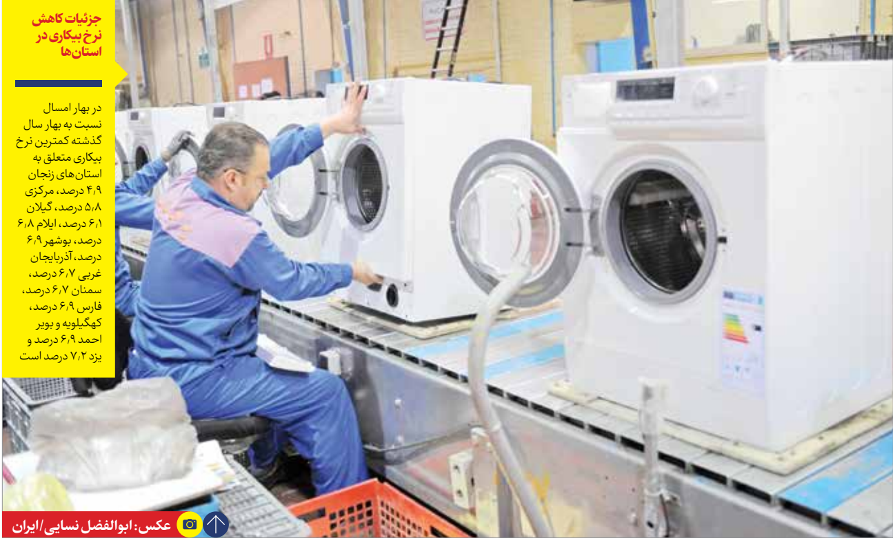
جزئیات کاهش نرخ بیکاری در استان ها

در بهار امسال نسبت به بهار سال گذشته کمترین نرخ بیکاری متعلق به استان های زنجان ۴٫۹ درصد، مرکزی ۵٫۸ درصد، گیلان ۶٫۹ درصد، ایلام ۶٫۸ درصد، بوشهر ۶٫۹ درصد، آذربایجان غربی ۶٫۷ درصد، سمنان ۶٫۷ درصد، فارس ۶٫۹ درصد، کهگیلویه و بویر احمد ۶٫۹ درصد و یزد ۷٫۲ درصد است