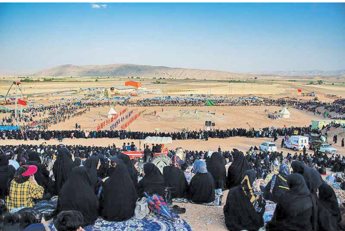
بزرگ‌ترین عزیمه میدانی کشور با شرکت بیش از ۵۰۰ نفر بازیگر و در زمینی به وسعت ۱۷۰ هزار مترمربع در نزدیکی روستای صحرارود شهرستان فسا در استان فارس که هر ساله میزبان عاشقان مکتب و راه امام حسین(ع) است، عصر روز پنجشنبه با نمایش واقعه غدیر تا کربلا با نام برکه غدیر تا گودال قتلگاه به نمایش گذاشته شد.