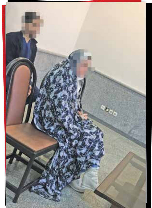
۱۳ دادگاه کفیری یک استان تهران فرستاده شد تا متهمان بزودی محاکمه شوند.